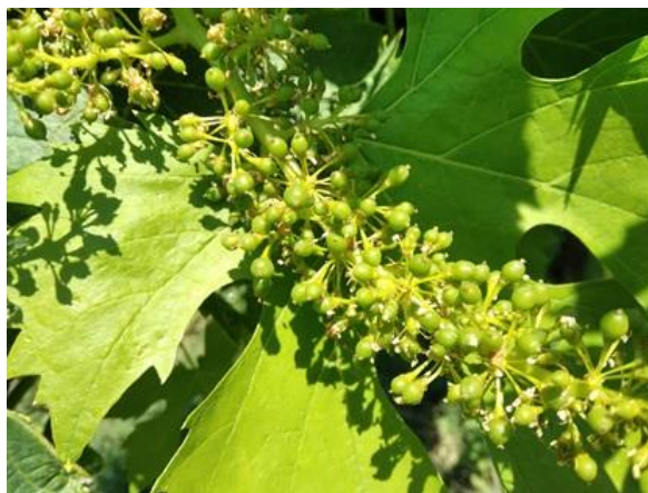
Allegagione BBCH 71