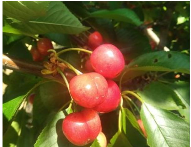
Ciliegio: maturazione di raccolta BBCH 87