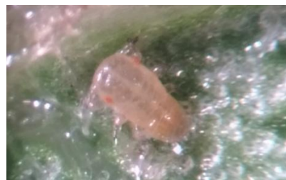
Neanide di Psilla del pero

È in oltre possibile effettuare la lotta attraverso l'utilizzo di insetti utili quali Antocoridi ( Anthocoris nemoralis ) per i quali si raccomanda di verificare la presenza in frutteto prima di effettuare i trattamenti insetticidi.