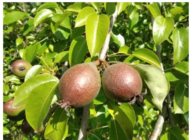
Pero: accrescimento frutto BBCH 74