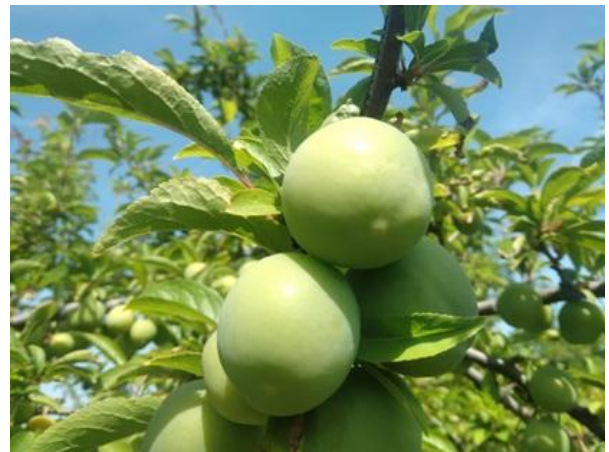
Susino: accrescimento frutti BBCH 79