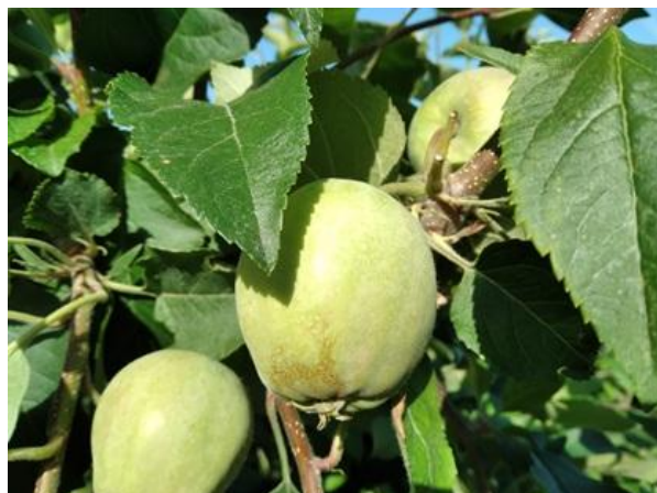
Melo: accrescimento frutto BBCH 74