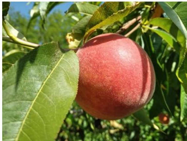
Pesco: invaiatura BBCH 81