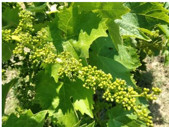
Inizio fioritura BBCH 61

La coltura si trova nella fase fenologica da inizio fioritura ad allegagione BBCH 61 - 71 .