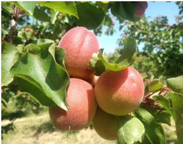
Albicocco: invaiatura BBCH 81

Nelle pomacee, il melo è nella maggior parte dei casi ad accrescimento frutto BBCH 74 così come il pero è ad accrescimento frutto BBCH 74 .