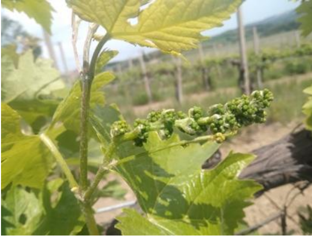
Bianchello - grappoli separati BBCH 55

La coltura si trova generalmente nella fase fenologica compresa fra grappoli separati e bottoni fiorali separati BBCH 55-57