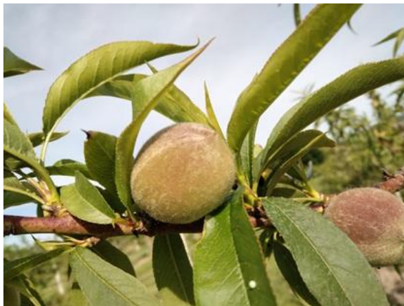
Pesco: accrescimento frutti BBCH 74