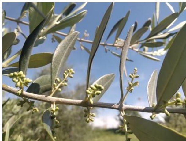
Mignolatura BBCH 54

La fase fenologica dell'olivo è quella di mignolatura BBCH 54 .