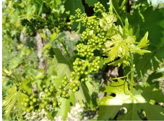
Sangiovese – bottoni fiorali separati BBCH 57