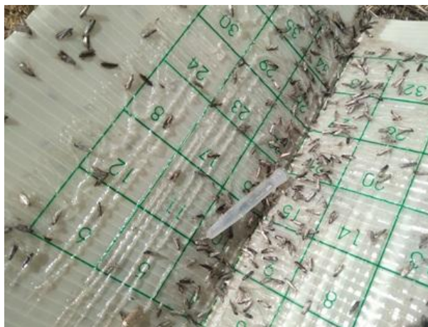
Adulti di Tignola dell'olivo su trappola

Dai monitoraggi effettuati nelle aziende della rete si rileva il volo della Tignola dell'olivo ( Prays oleae ) con catture di diverse centinaia di individui/trappola.