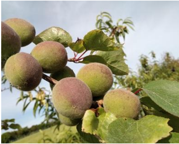
Albicocco: accrescimento frutto BBCH 79