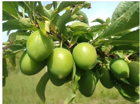
Susino: accrescimento frutti BBCH 78