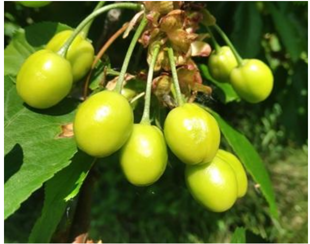
Ciliegio: accrescimento frutti BBCH 76