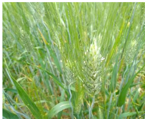
Grano duro, fine fioritura BBCH 69

Si ribadisce infatti l'importanza di intervenire al raggiungimento della fase di spigatura/inizio fioritura, con un intervento preventivo per il controllo della Fusariosi della spiga per evitare il possibile sviluppo di micotossine pericolose per la salute umana. Per i prodotti da impiegare si rimanda al Notiziario n. 15