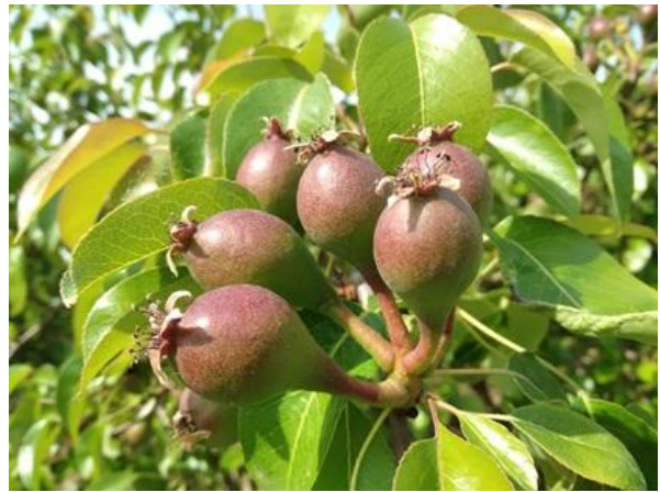
Pero: frutto noce BBCH 73