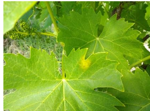
Sintomo di Peronospora

Dai monitoraggi effettuati in campo in alcuni vigneti è stata rilevata la presenza dei primi sintomi di peronospora, per cui si raccomanda la massima attenzione nella gestione della difesa , vista anche la delicata fase fenologica della vite.