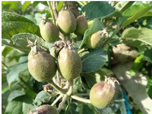
Melo: frutto noce BBCH 73