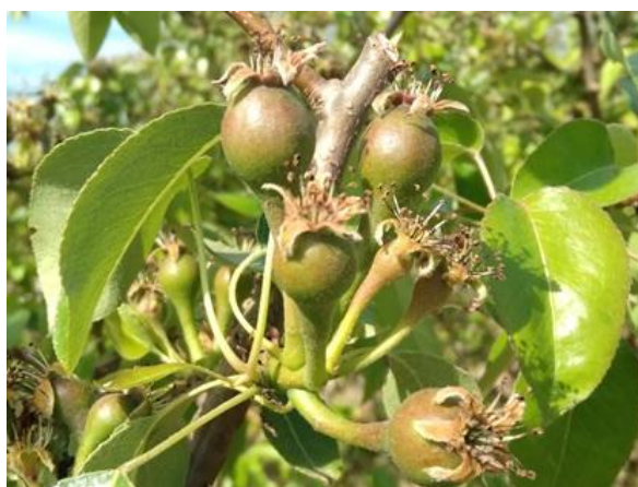
Pero: accrescimento frutti BBCH 72