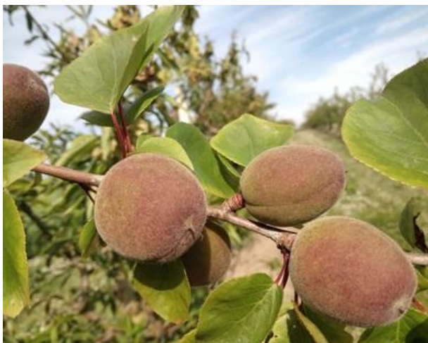
Albicocco: accrescimento frutto BBCH 78

Le fasi fenologiche dei fruttiferi sono nella maggior parte dei casi le seguenti: albicocco accrescimento frutti BBCH 74-78 , il susino si trova ad accrescimento frutti BBCH 74 , il pesco ad accrescimento frutti BBCH 74 , il ciliegio è, nella maggior parte dei casi ad accrescimento frutti BBCH 74 . Nelle pomacee, il melo è nella maggior parte dei casi ad allegagione BBCH 71 mentre il pero è da allegagione ad accrescimento frutti BBCH 71-72 .