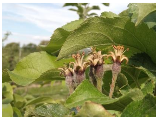
Melo: allegagione BBCH 71