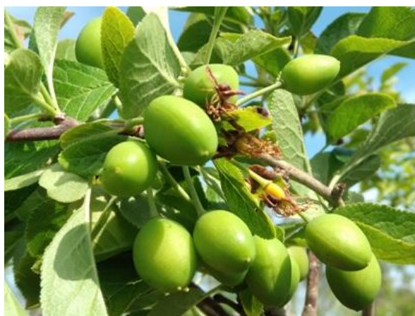
Susino: accrescimento frutti BBCH 74