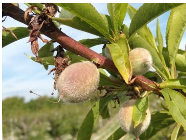
Pesco: accrescimento frutti BBCH 74