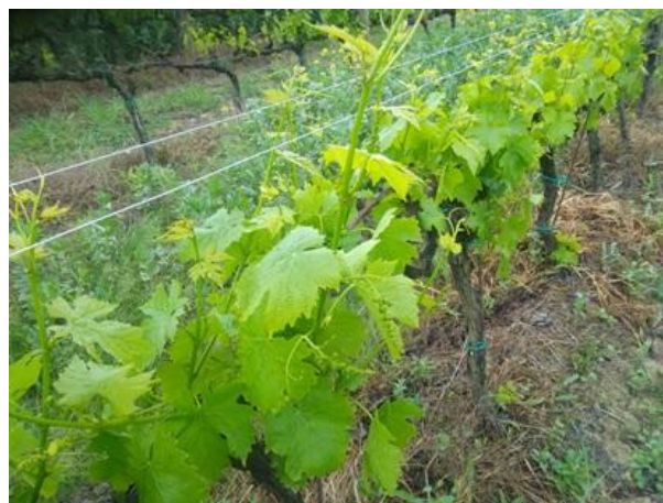
Grappoli separati BBCH 55