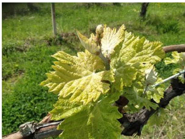
Grappoli appena visibili BBCH 53

La fase fenologica della vite è compresa fra grappoli appena visibili e infiorescenze rigonfie con fiori raggruppati fra loro BBCH 53-55 .