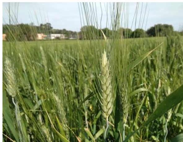
Emissione antere BBCH 61

Al momento nei siti della rete di monitoraggio, si riscontrano solo sporadicamente, negli appezzamenti più fitti, attacchi di Oidio mentre nella maggior parte degli appezzamenti non si evidenziano particolari problematiche fitosanitarie, si consiglia comunque di monitorare i propri appezzamenti e, nell'esecuzione del trattamento fungicida consigliato contro la Fusariosi , valutare l'impiego delle sostanze attive più idonee al controllo anche di ulteriori eventuali altre crittogame.