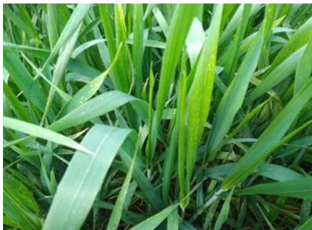
Foglia a bandiera arrotolata BBCH 37

I cereali autunno-vernini sono nella maggior parte degli appezzamenti nella fase fenologica compresa fra prime reste visibili e solo eccezionalmente in alcuni appezzamenti con cultivar precoci a inizio fioritura BBCH 49-61 .