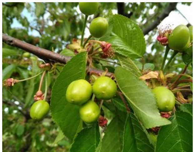
Ciliegio: accrescimento frutti BBCH 74