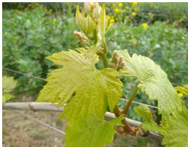
Grappoli visibili BBCH 53

Anche questa settimana la fase fenologica della vite si presenta molto disforme, con alcuni vigneti ancora fermi alla fase di apertura gemme ed altri che sono già a grappoli visibili. Da lunedì ad oggi si sono verificate condizioni di tempo instabile, con precipitazioni di entità modesta ed intensità molto variabile. Per i prossimi giorni sono invece previste condizioni di tempo stabile e soleggiato fino a domenica, poi un nuovo passaggio perturbato che dovrebbe portare nuovamente precipitazioni su tutto il territorio provinciale. Le temperature sono in sensibile calo.