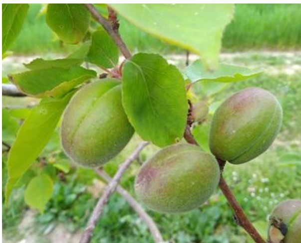
Albicocco: accrescimento frutto BBCH 76

Nelle pomacee, il melo è nella maggior parte dei casi a piena fioritura BBCH 65 mentre il pero è da allegazione ad accrescimento frutti BBCH 71-72 .