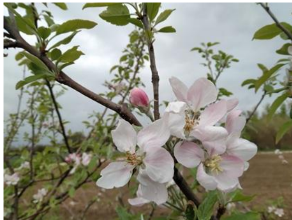
Melo: piena fioritura BBCH 60