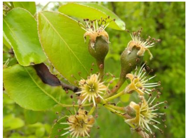
Pero: accrescimento frutti BBCH 72