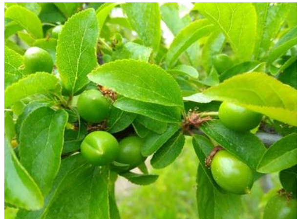
Susino: accrescimento frutti BBCH 74