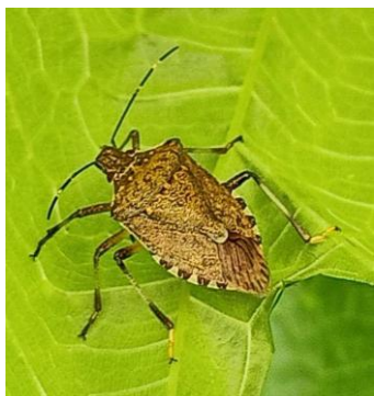
Adulto di cimice asiatica

Gli individui svernanti di cimice asiatica ( Halyomorpha halys ) stanno lasciando i ricoveri invernali. Al fine di contenere la popolazione potrebbe essere utile, già da questo momento, predisporre trappole per la cattura massale nei pressi dei siti di svernamento come centri aziendali o in prossimità dei manufatti o in prossimità di potenziali ricoveri naturali. Le trappole possono essere acquistate e attivate con appositi feromoni oppure possono anche essere realizzate artigianalmente impiegando totem con attrattivi e pannelli collati.