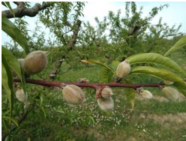
Pesco: accrescimento frutti BBCH 74