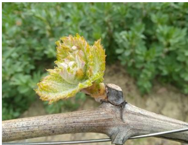
Apertura gemme BBCH 08

La fase fenologica della vite è compresa fra apertura gemme e grappoli visibili BBCH 08-53 . Resta marcata la difformità fra le cultivar ma anche in funzione delle condizioni specifiche dei vigneti (esposizione, altitudine, pedologia, ecc.), e della gestione (tipologia ed epoca di potatura, concimazioni, ecc.).