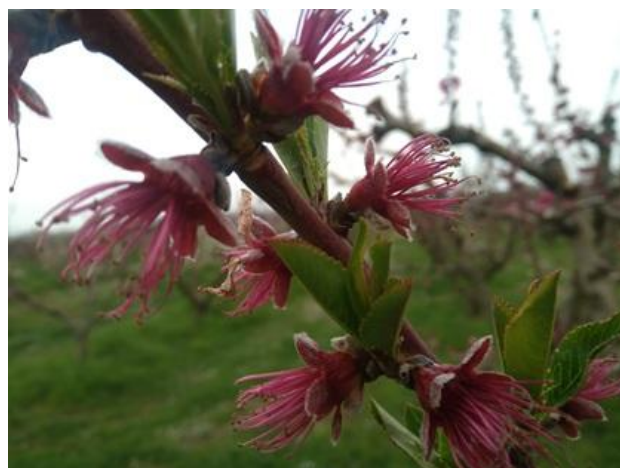
Pesco: allegagione BBCH 71