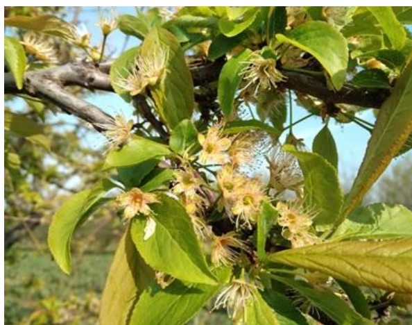
Susino: allegagione BBCH 71