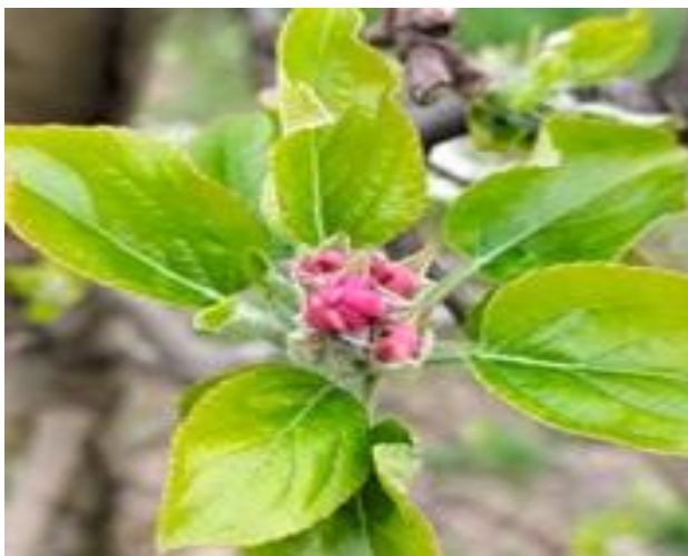
Melo: bottoni rosa BBCH 57