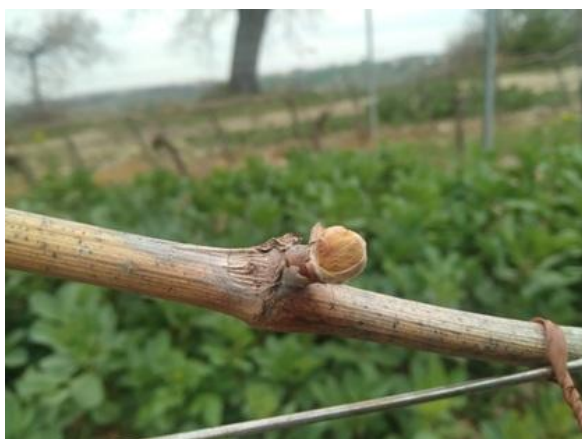
Rigonfiamento gemme BBCH 01

La fase fenologica della vite è compresa fra rigonfiamento gemme e apertura gemme BBCH 01-08 . Lo sviluppo è stato rallentato dalle basse temperature dell'ultimo periodo e si denota una certa disomogeneità fra le cultivar. Al momento non si consiglia alcun intervento.