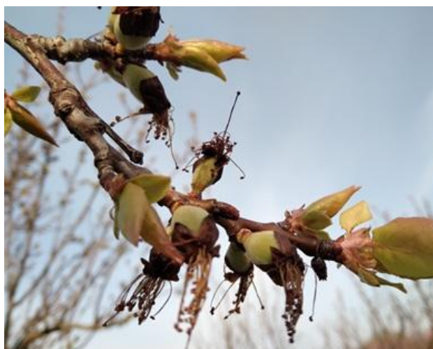
Albicocco: scamicatura BBCH 72

Nelle pomacee, il melo è nella maggior parte dei casi a bottoni rosa BBCH 57 mentre il pero è da inizio fioritura ad allegagione BBCH 60-71 .