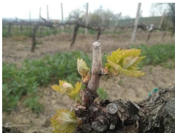
Apertura gemme BBCH 08