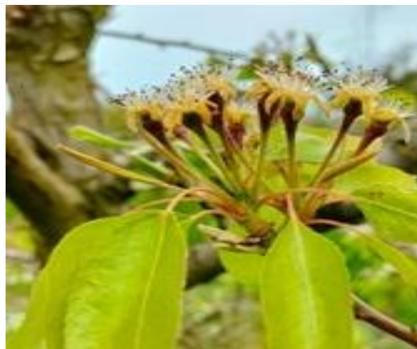
Pero: allegagione BBCH 71