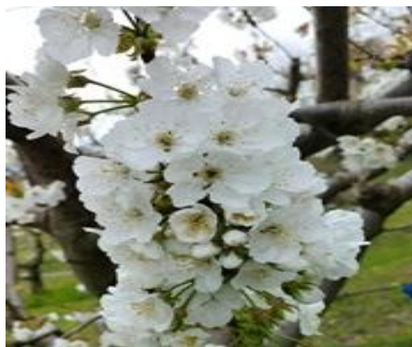
Ciliegio: piena fioritura BBCH 65