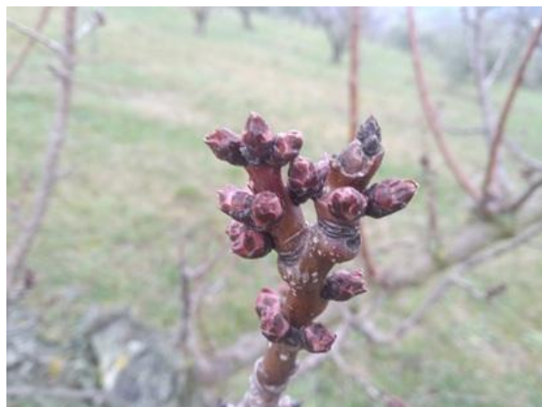
Cultivar di pesco e di albicocco, più precoci, nella fase di rigonfiamento gemme BBCH 01

Tutti i principi attivi indicati nel Notiziario sono previsti nelle "Linee Guida per la Produzione Integrata delle colture, Difesa Fitosanitaria e Controllo delle Infestanti" della Regione Marche 2025 Finestra Estiva approvate con Decreto del Dirigente Direzione Agricoltura e Sviluppo Rurale n. 380 del 17 giugno 2025.