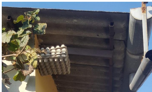
Trappola per la cattura massale tipo "cartone delle uova"