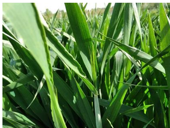
Frumento duro: Da 2° nodo a prime reste visibili BBCH 32-51