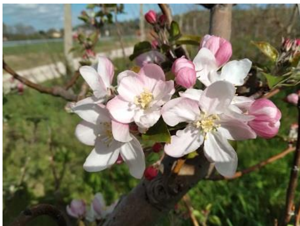
Melo: inizio fioritura BBCH 60