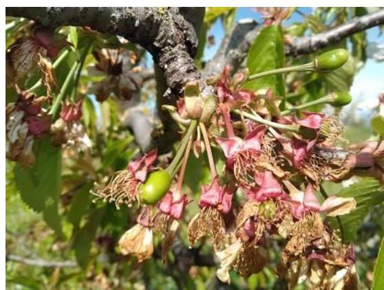
Ciliegio: scamicatura BBCH 72

Per le pomacee il melo si trova nella fase di mazzetti divaricati e inizio fioritura BBCH 59-60 mentre la fase fenologica del pero è fra fine fioritura e allegazione BBCH 69-71 .