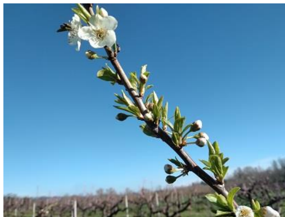
Susino inizio fioritura BBCH 60

Si ricorda che, durante il periodo della fioritura (periodo che va dalla schiusura dei fiori alla caduta dei petali), ai sensi della L.R. 33/12 e successiva modifica in materia apistica, sono vietati i trattamenti con prodotti fitosanitari ad azione insetticida ed acaricida. Si rimanda al testo della legge presente al seguente link . B.U. 23 febbraio 2023, n. 18