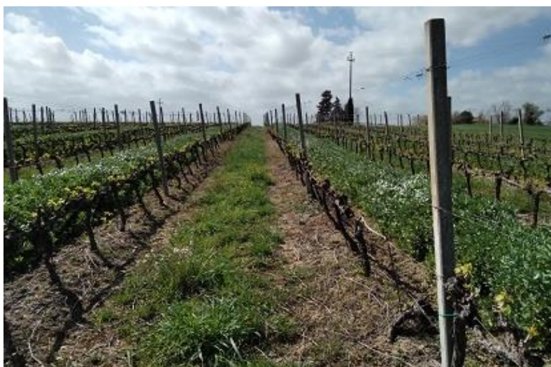
Foto 1: diserbo sottofila su vigneto con inerbimento naturale alternato a favino da sovescio.

L'inerbimento temporaneo invece è costituito da specie erbacee specifiche appositamente seminate, meglio se con ciclo autunno-primaverile.