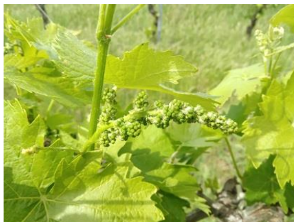
Vite: Da grappolini visibili a grappoli separati BBCH 53-55

La vite è ormai recettiva a possibili attacchi di Peronospora pertanto occorre la massima attenzione alla difesa.