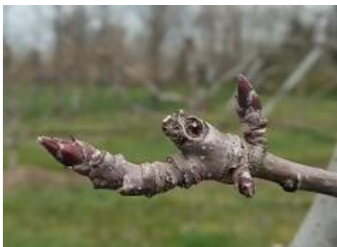
Melo: gemma dormiente BBCH 00

Risulta molto evidente la differenza di sviluppo vegetativo fra le cultivar precoci rispetto a quelle più tardive. L' albicocco è nella maggior parte dei casi nella fase fenologica compresa fra bottoni bianchi e inizio fioritura BBCH 57-60 , il susino manifesta la maggiore variabilità e va da boccioli appena visibili a piena fioritura BBCH 55-65 , il pesco fra bottone rosa e inizio fioritura BBCH 57-60 , il ciliegio è nella fase di rigonfiamento gemma BBCH 01 il melo e il pero sono fra gemma dormiente e rigonfiamento gemma BBCH 00-01 .