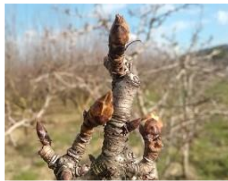
Pero: rigonfiamento gemma BBCH 01

Si ricorda che per effetto della L.R. 33/12 Art 8 comma 1: “Durante il periodo di fioritura sono vietati i trattamenti con prodotti fitosanitari.