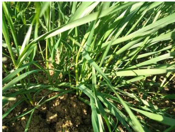
fine accestimento BBCH 29

Negli appezzamenti che hanno raggiunto la fase fenologica di accestimento, è opportuno iniziare a programmare l'esecuzione della prima concimazione azotata.