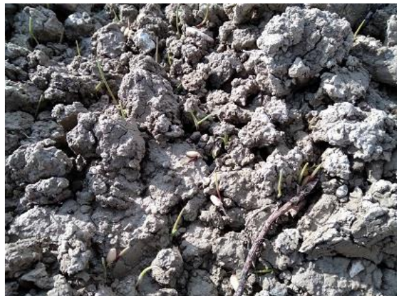
Emergenza BBCH 10

Si segnalano sporadici ed occasionali ingiallimenti solo in alcuni appezzamenti e soprattutto nelle capezzagne riconducibili a ristagni idrici.