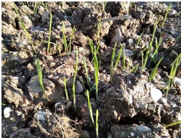
Una foglia distesa BBCH 11

La fase fenologica dei cereali autunno vernini è particolarmente disomogenea a causa delle semine molto scalari dovute alle condizioni meteo avverse, i primi seminati, a fine ottobre, hanno raggiunto l'inizio dell'accestimento con la comparsa del primo culmo BBCH 21 , mentre quelli seminati più tardivamente, la fase è di emergenza o 1 foglia vera BBCH 09-11 , una parte piuttosto consistente deve invece ancora essere seminata ma l'impraticabilità dei campi dovuta alle continue e abbondanti precipitazioni costringe ancora ad aspettare per poter effettuare tale operazione. Si segnalano solo sporadici ed occasionali ingiallimenti in alcuni appezzamenti.