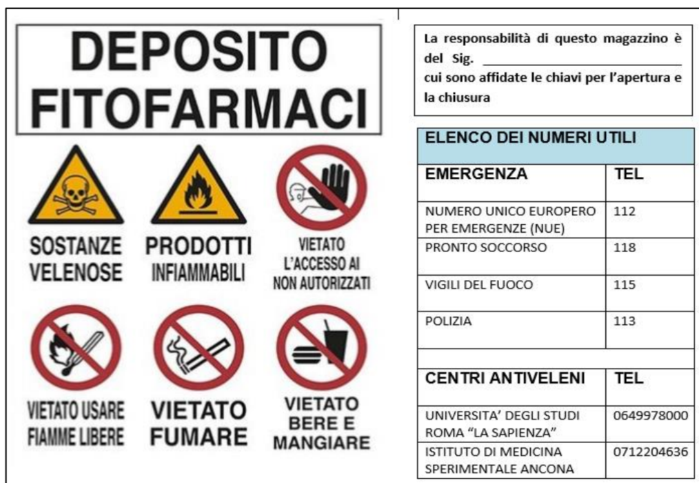
Figura 1 – Le indicazioni e i pittogrammi da apporre all'ingresso del locale adibito a deposito fitofarmaci

b) chiusi a chiave in un armadio in metallo, con apposite feritoie per l'aerazione, anche in questi casi va apposta la segnaletica di sicurezza. (Figura 1)