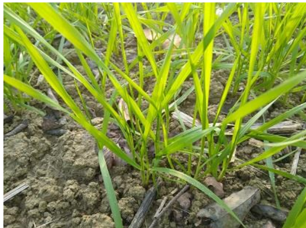
Inizio accestimento BBCH 21