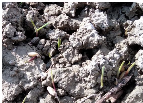
Frumento duro: emergenza BBCH 09