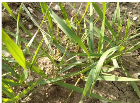
Frumento duro: accestimento BBCH 23

Nei pochi appezzamenti seminati a fine ottobre – inizio novembre la fase fenologica raggiunta è quella di accestimento BBCH 23 , in quelli seminati a metà novembre è di due foglie vere BBCH 12 , mentre nei restanti, seminati tardivamente in dicembre, i cereali sono in emergenza BBCH 09 .