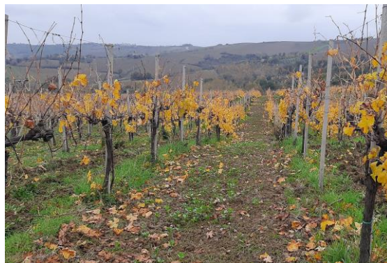
Vite: fase fenologica fine caduta foglie BCCH 97

Da questo periodo si può iniziare ad eseguire la potatura invernale della vite, fino a prima della ripresa vegetativa, generalmente prevista in aprile .