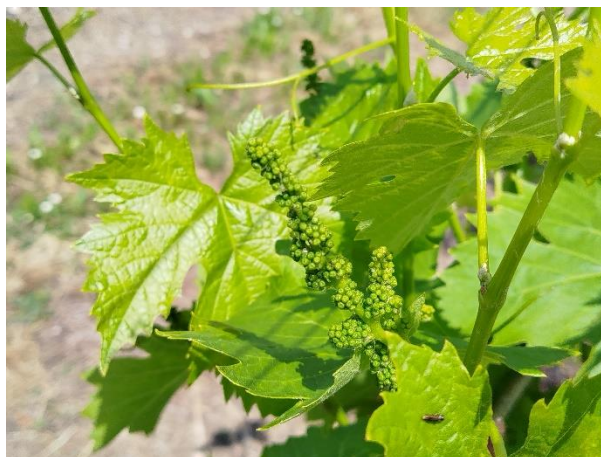
Sangiovese – bottoni fiorali separati (BBCH 57)