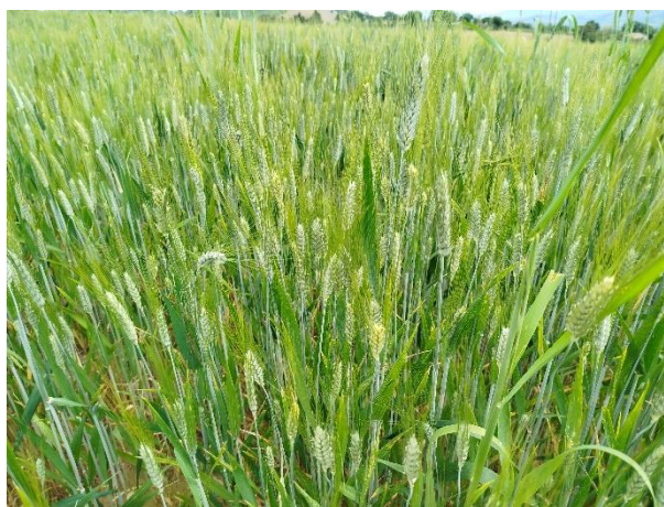
Grano duro – fine fioritura (BBCH 69)

Al raggiungimento della fase di inizio fioritura, si consiglia un intervento preventivo per il controllo della Fusariosi della spiga per evitare il possibile sviluppo di micotossine pericolose per la salute umana. Si consiglia pertanto, a quanti non avessero ancora provveduto , di intervenire con i prodotti riportati nel Notiziario n. 15/2026