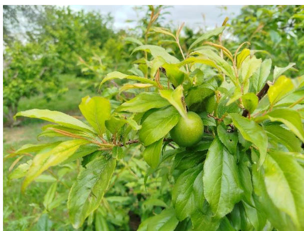
Susino - sviluppo frutti (BBCH 75)