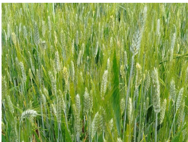
Grano duro – fine fioritura (BBCH 69)

La coltura si trova generalmente nella fase fra inizio fioritura – fine fioritura (BBCH 61 - 69).