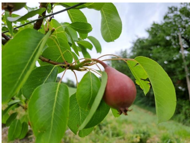
Pero - sviluppo frutti (BBCH 72)