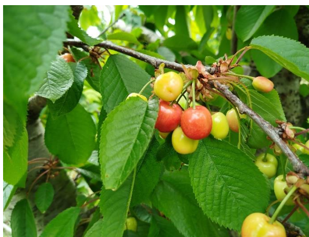
Ciliegio – inizio invaiatura (BBCH 81)