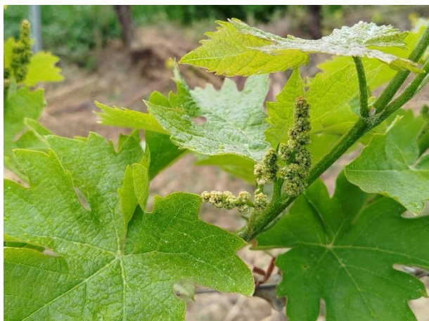
Montepulciano - grappoli separati (BBCH 55)

La coltura si trova generalmente nella fase fenologica fra grappoli separati – bottoni fiorali separati (BBCH 55-57)