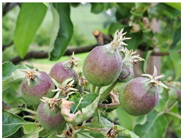
Melo - sviluppo frutti (BBCH 73)