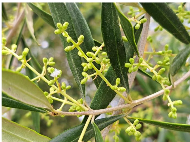
Olivo - mignolatura (BBCH 55)

La coltura si trova generalmente nella fase fenologica compresa di mignolatura (BBCH 55 - 57)