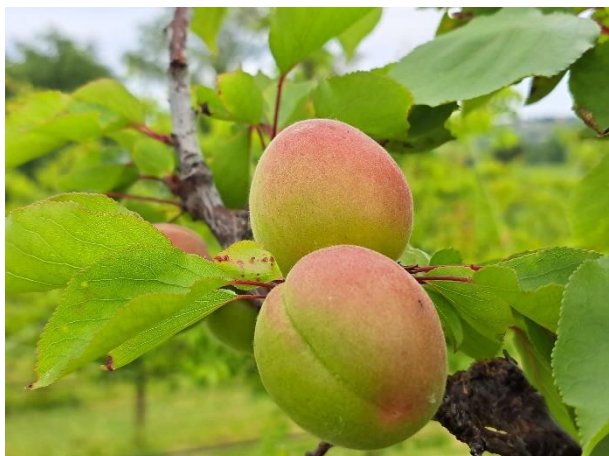
Albicocco – inizio invaiatura (BBCH 81)