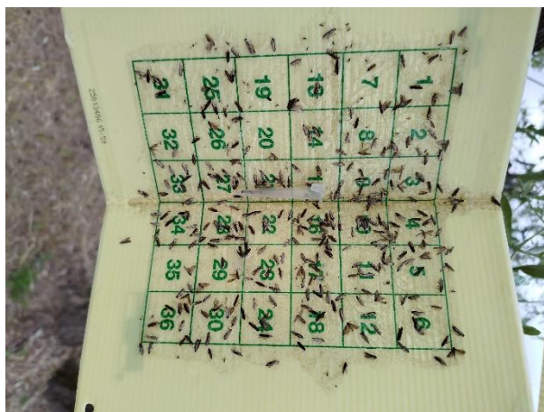
Olivo – catture Prays oleae

Dai monitoraggi effettuati nelle aziende della rete si rileva il volo della Tignola dell'olivo ( Prays oleae ) con catture di diverse centinaia di individui/trappola, pertanto, esclusivamente nelle aziende a conduzione biologica , si consiglia, dopo le piogge dei prossimi giorni, e comunque entro sabato 9, di effettuare un trattamento sulla generazione antofaga, con Bacillus thuringiensis (♣) o, in alternativa, con Silicato di alluminio (caolino calcinato) (♣), seguendo le indicazioni riportate in etichetta.