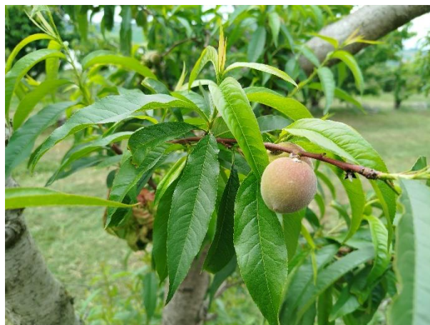
Pesco - sviluppo frutti (BBCH 76)