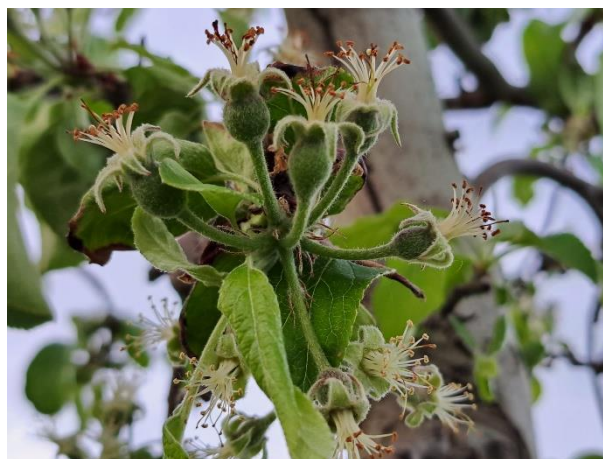
Melo - allegagione (BBCH 71)