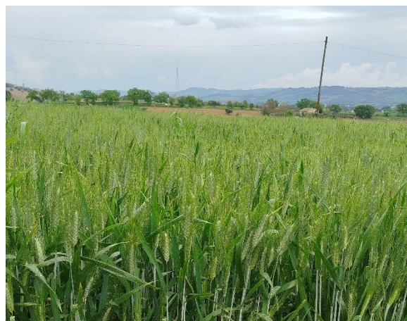
Grano duro – spigatura (BBCH 59)