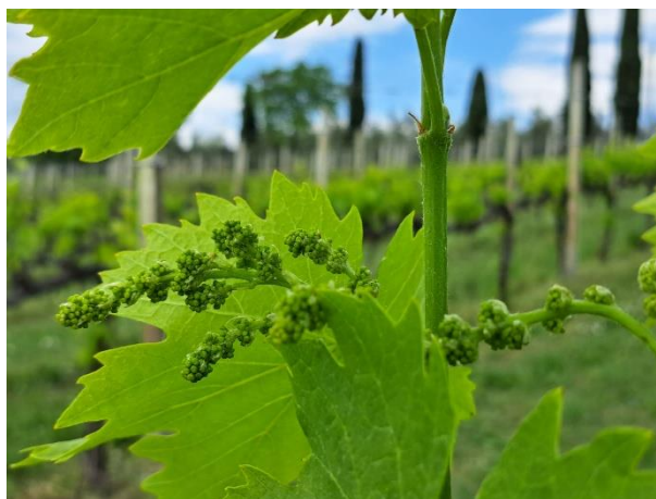
Sangiovese – grappoli separati (BBCH 55)