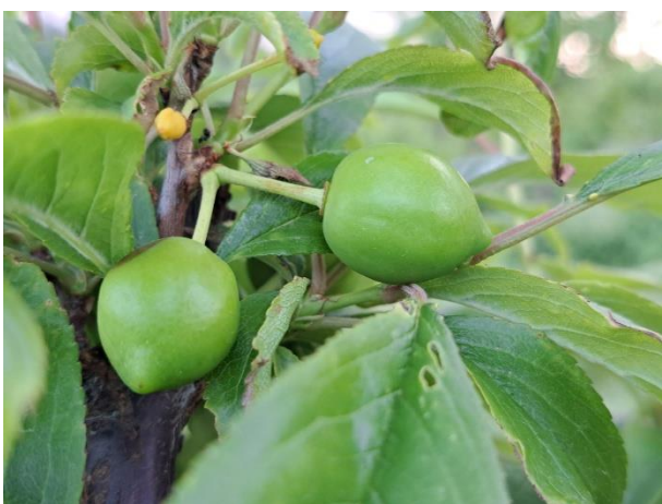
Susino - sviluppo frutti (BBCH 73)