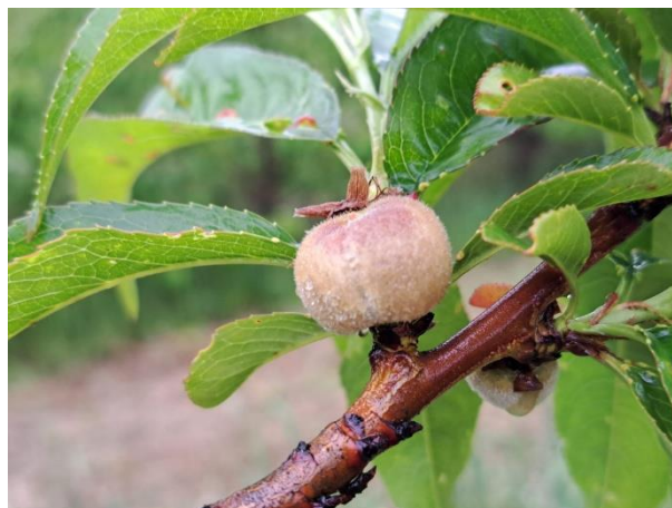
Pesco - sviluppo frutti (BBCH 73)