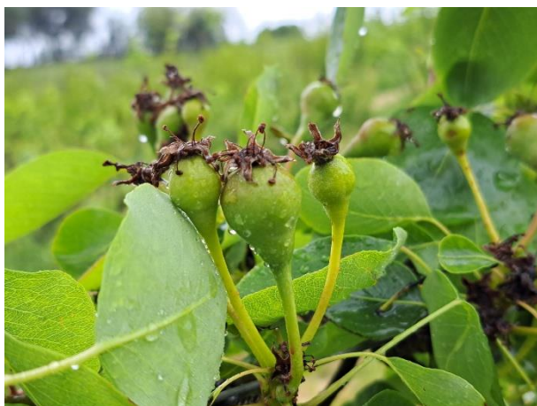
Pero – sviluppo frutti (BBCH 72)