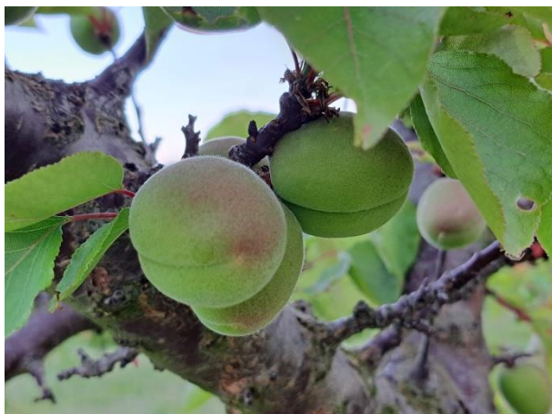
Albicocco - sviluppo frutti (BBCH 75)