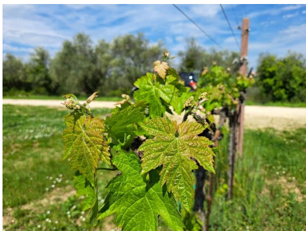
Montepulciano – grappoli visibili (BBCH 53)

La coltura si trova generalmente nella fase fenologica fra grappoli visibili e grappoli separati (BBCH 53-55)