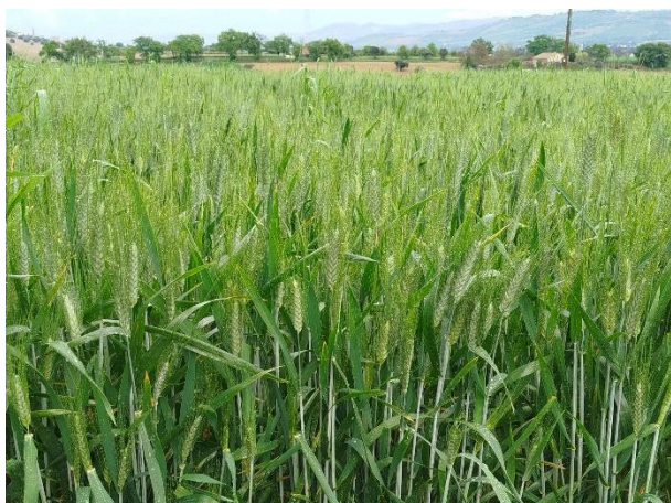
Grano duro – spigatura (BBCH 59)

La coltura si trova generalmente nella fase fra botticella e fine spigatura (BBCH 41 - 59) .