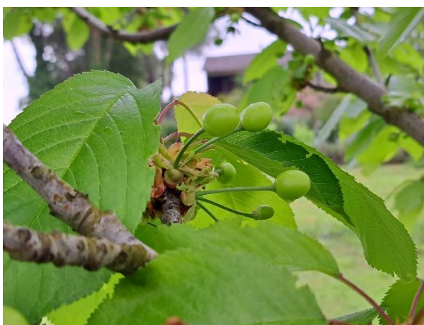
Ciliegio – sviluppo frutti (BBCH 73)