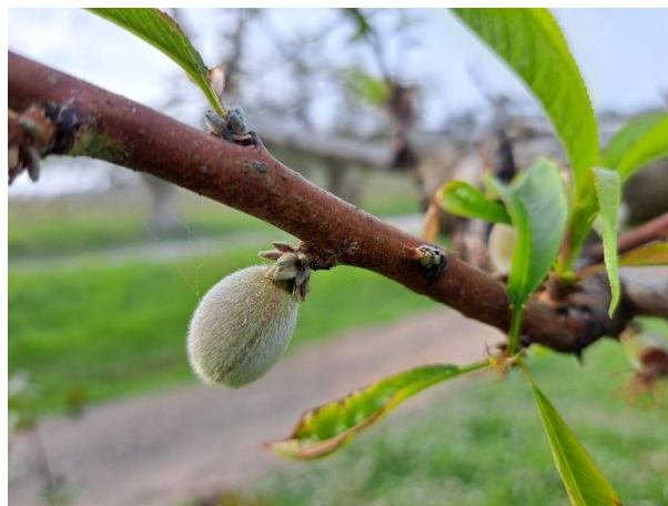
Pesco - sviluppo frutti (BBCH 73)