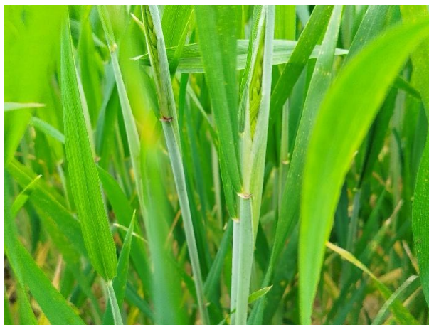
Grano duro – inizio spigatura (BBCH 51)

Le aziende che hanno scelto di frazionare la concimazione azotata in 3 interventi, in concomitanza con il raggiungimento della fase di botticella, è opportuno che procedano al completamento della concimazione azotata secondo le indicazioni contenute nel Notiziario Agrometeorologico 4/2026 .