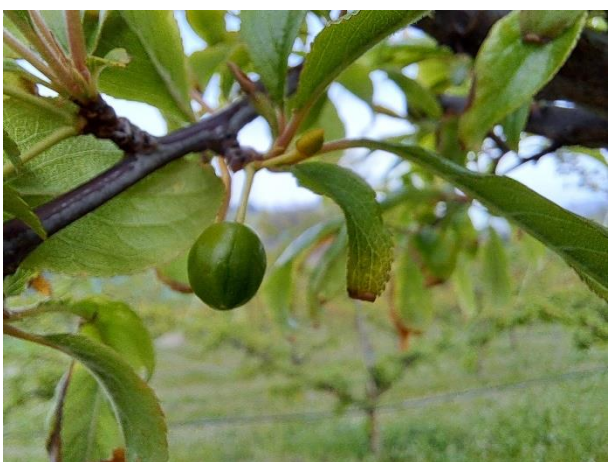
Susino - sviluppo frutti (BBCH 73)