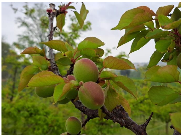
Albicocco - sviluppo frutti (BBCH 74)