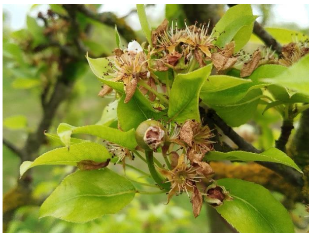
Pero - sviluppo frutti (BBCH 72)