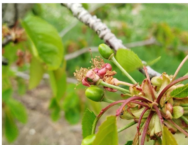
Ciliegio - allegazione (BBCH 71)