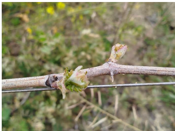
Montepulciano – apertura gemme (BBCH 11)

La coltura si trova generalmente nella fase fenologica fra apertura gemme e grappoli visibili (BBCH 07-51)