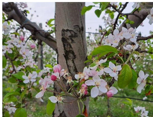
Melo - inizio caduta petali (BBCH 67)