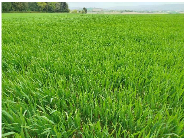
Grano duro – botticella (BBCH 49)

La coltura si trova generalmente nella fase fra 3° nodo e inizio spigatura (BBCH 33 - 51) .