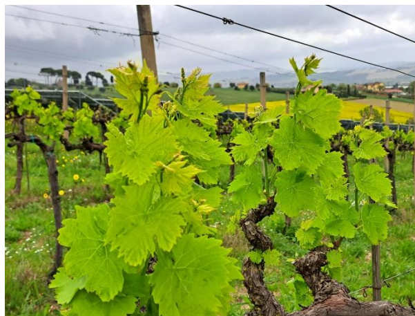
Sangiovese – grappoli visibili (BBCH 51)

Anche questa settimana la fase fenologica della vite si presenta molto disforme, con alcuni vigneti ancora fermi alla fase di apertura gemme ed altri che sono già a grappoli visibili. Da lunedì ad oggi si sono verificate condizioni di tempo instabile, con precipitazioni di entità modesta ed intensità molto variabile. Per i prossimi giorni sono previste condizioni di tempo stabile e soleggiato fino a domenica, poi un nuovo passaggio perturbato che dovrebbe portare nuovamente precipitazioni su tutto il territorio provinciale.