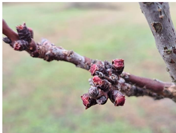
Albicocco rigonfiamento gemme BBCH 01

Tutti i principi attivi indicati nel Notiziario sono previsti nelle "Linee Guida per la Produzione Integrata delle colture, Difesa Fitosanitaria e Controllo delle Infestanti" della Regione Marche 2025 Finestra Estiva approvate con Decreto del Dirigente Direzione Agricoltura e Sviluppo Rurale n. 380 del 17 giugno 2025. Link al disciplinare di difesa integrata 2025 Finestra Estiva