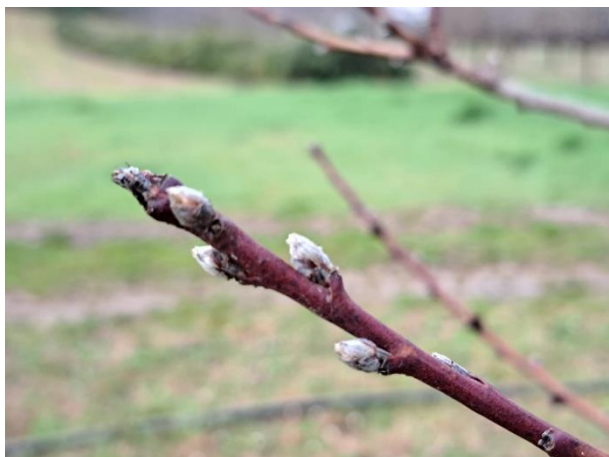
Pesco rigonfiamento gemme BBCH 01

Si raccomanda di prestare attenzione al limite massimo di interventi ammessi sia come sostanza attiva ma soprattutto come avversità, ad esempio nel caso della Monilia di albicocco e ciliegio potendo effettuare l'intervento per un massimo di tre volte all'anno è consigliabile attendere di intervenire a bottoni fiorali sviluppati, a fine fioritura ed eventualmente se necessario in pre-raccolta.