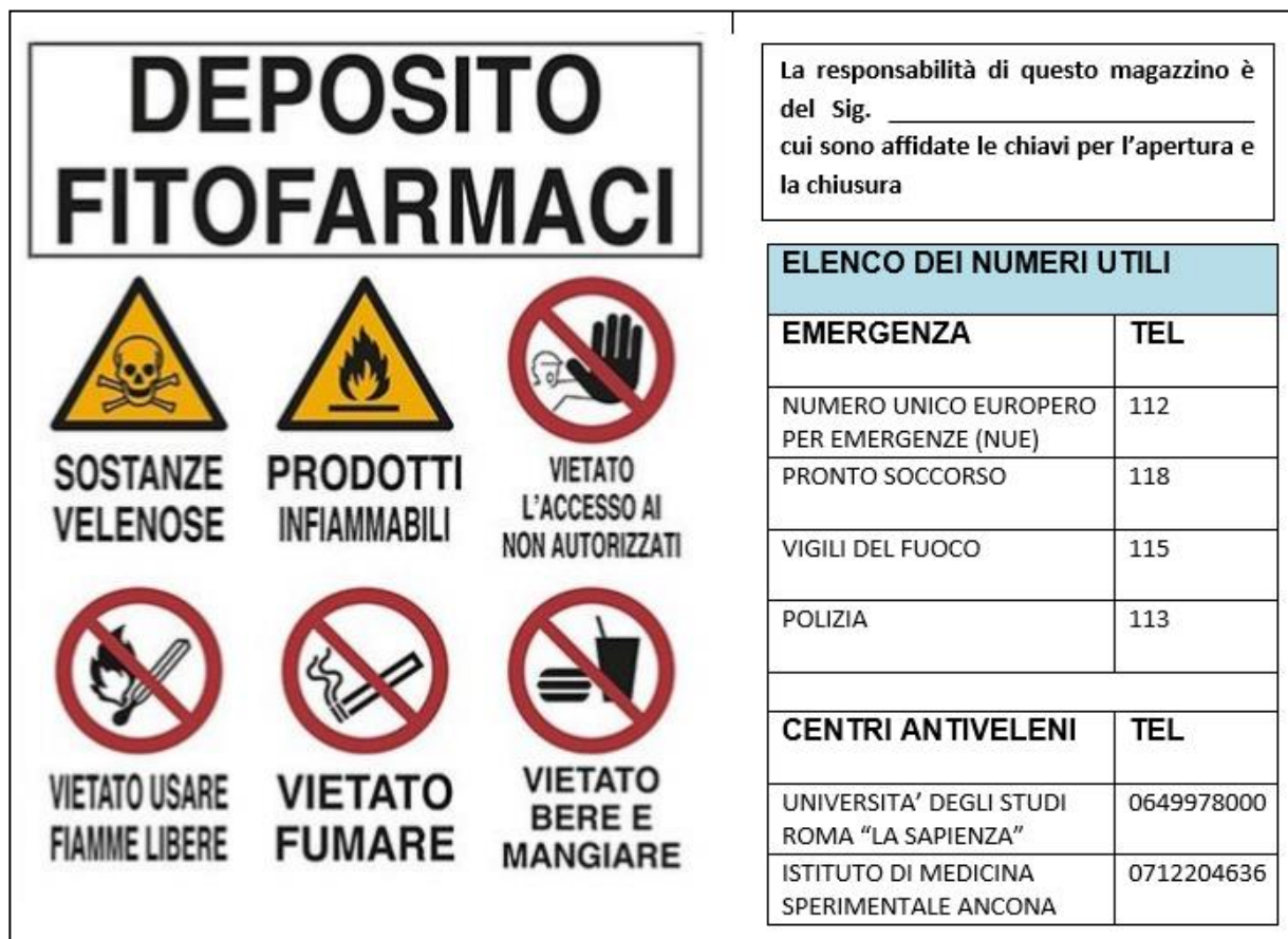
Figura 1 - Le indicazioni e i pittogrammi da apporre all'ingresso del locale adibito a deposito fitofarmaci