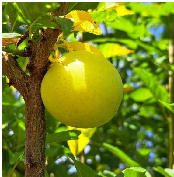
Susino – Inizio invaiatura (BBCH 81)