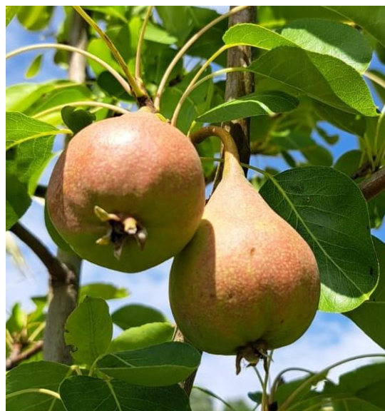
Pero - sviluppo frutti (BBCH 76)

Restano sopra soglia le catture di Anarsia su Pesco , perciò si consiglia, a quanti non l'avessero ancora fatto, di intervenire secondo le indicazioni riportate nel Notiziario 23 del 14.06.2023 .