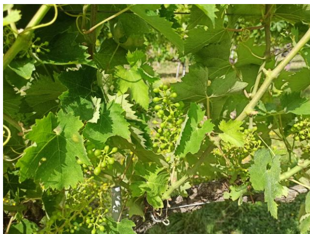
Montepulciano – allegazione BBCH 73

La fase fenologica della vite è mignolatura – prechiusura grappolo (BBCH 73 - 77) .