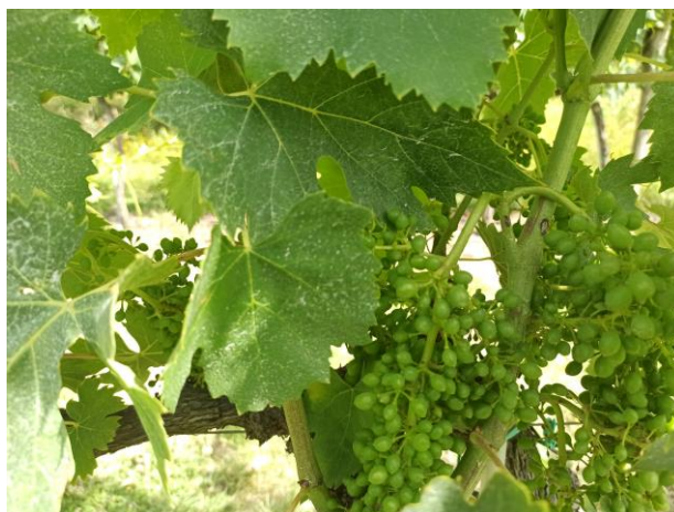
Sangiovese – prechiusura grappolo BBCH 77