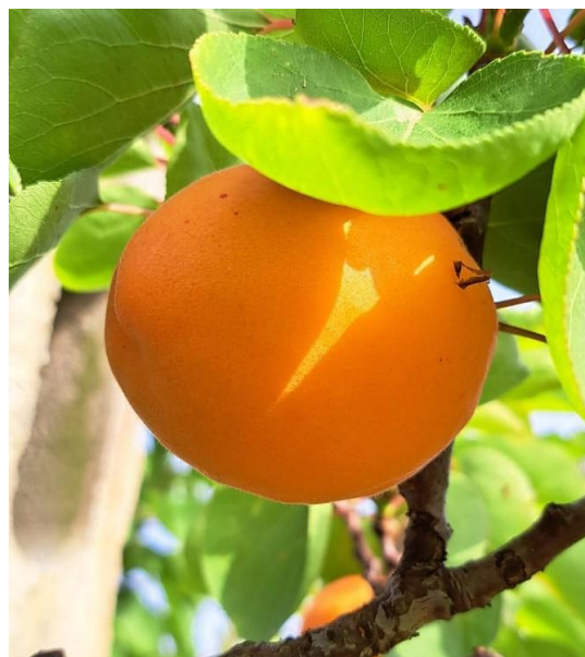
Albicocco - Maturazione (BBCH 87)