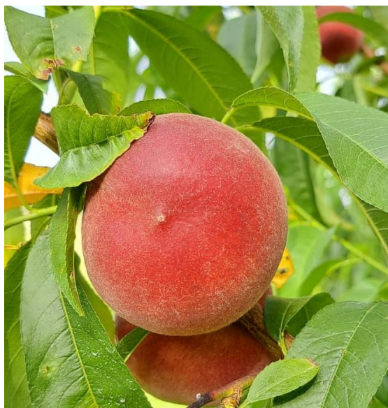
Pesco - Maturazione (BBCH 85)