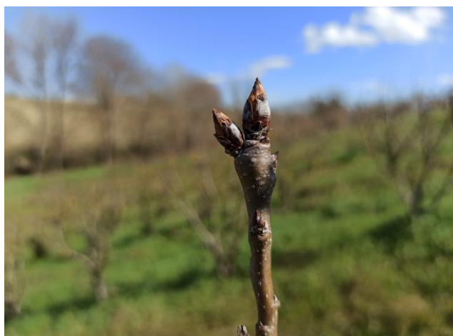
Pero – rigonfiamento gemme (BBCH 01)