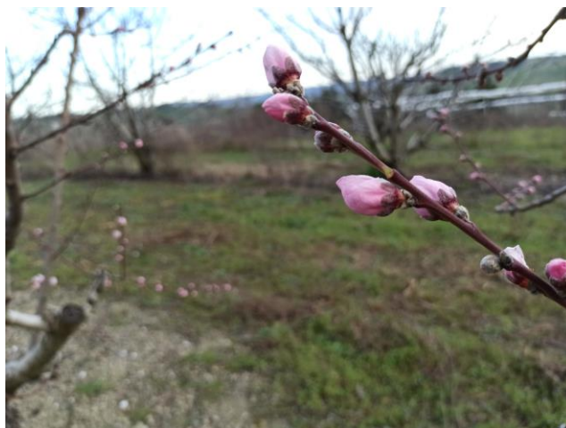
Pesco – inizio fioritura (BBCH 60)