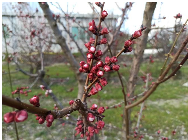
Albicocco - bottoni rossi (BBCH 55)