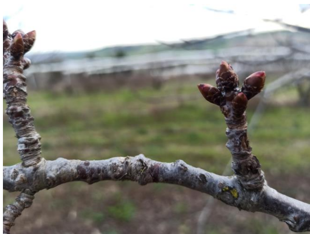
Ciliegio – rigonfiamento gemme (BBCH 01)