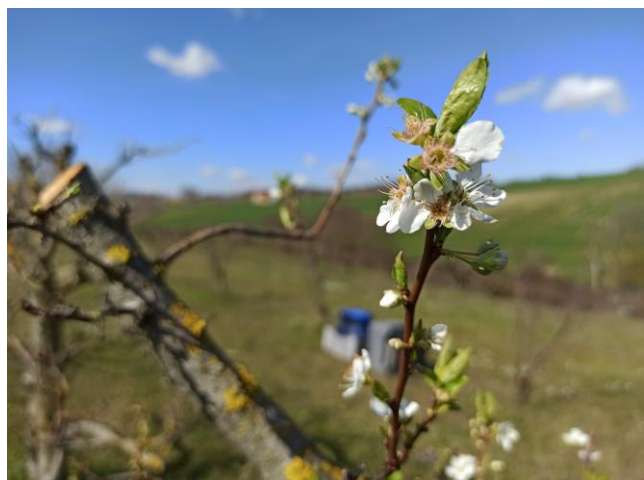
Susino – inizio fioritura (BBCH 61)