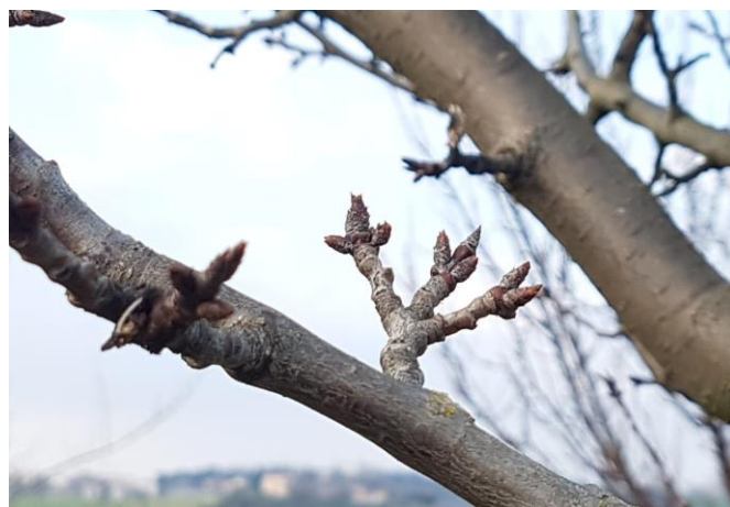
Susino – riposo vegetativo (BBCH 00)