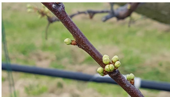
Susino – bottoni bianchi (BBCH 55)