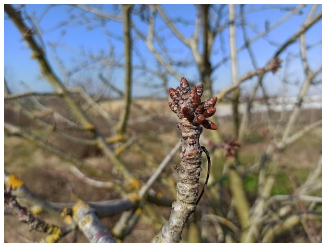
Ciliegio – riposo vegetativo (BBCH 00)