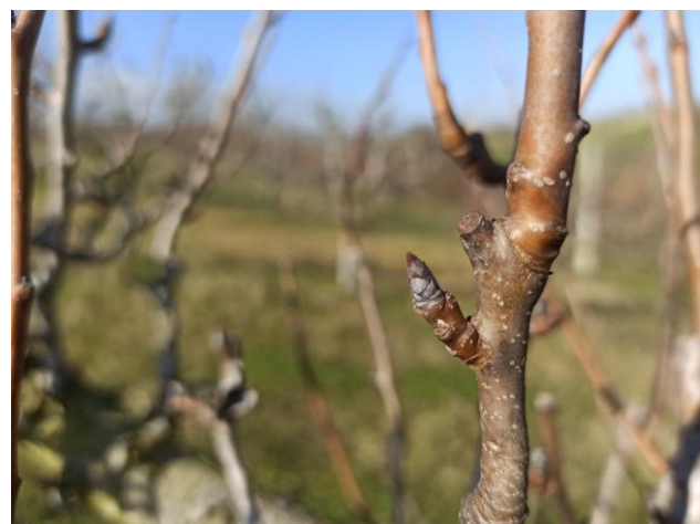
Melo – riposo vegetativo (BBCH 00)