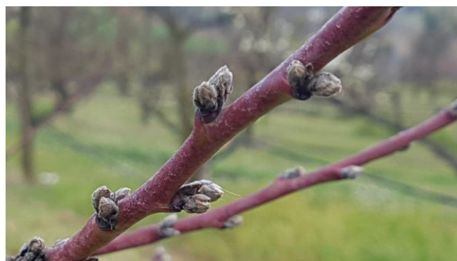
Pesco – rigonfiamento gemme (BBCH 01)