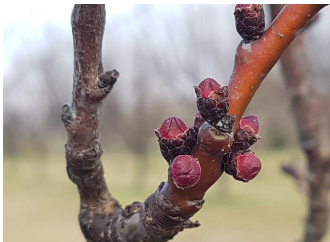
Albicocco - bottoni rosso (BBCH 55)