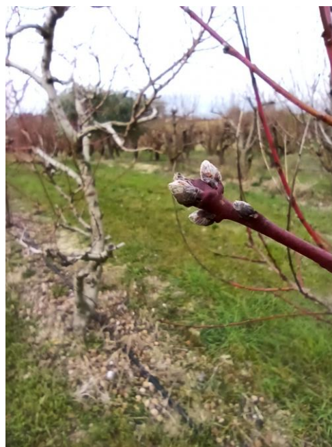
Pesco – rigonfiamento gemme (BBCH 01)