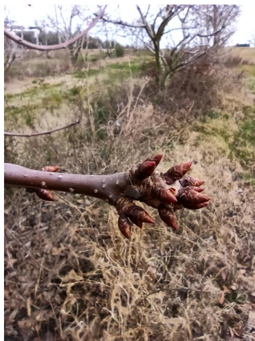
Ciliegio – riposo vegetativo (BBCH 00)