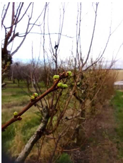
Susino - rigonfiamento gemme (BBCH 01)