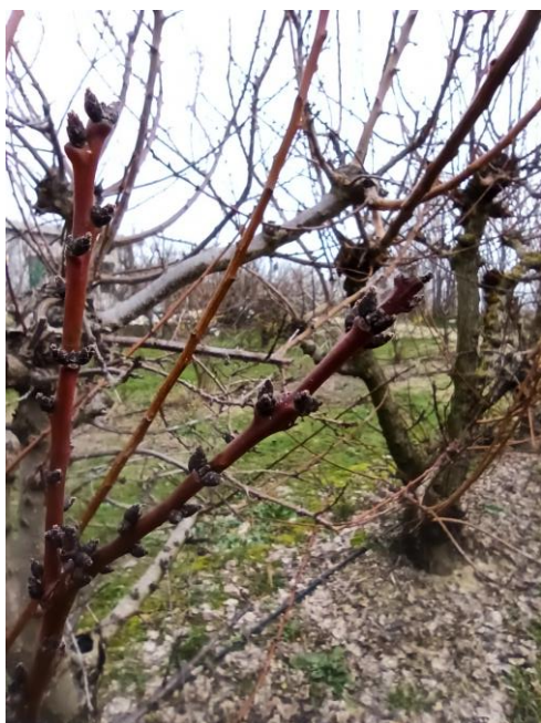
Albicocco - rigonfiamento gemme (BBCH 00)