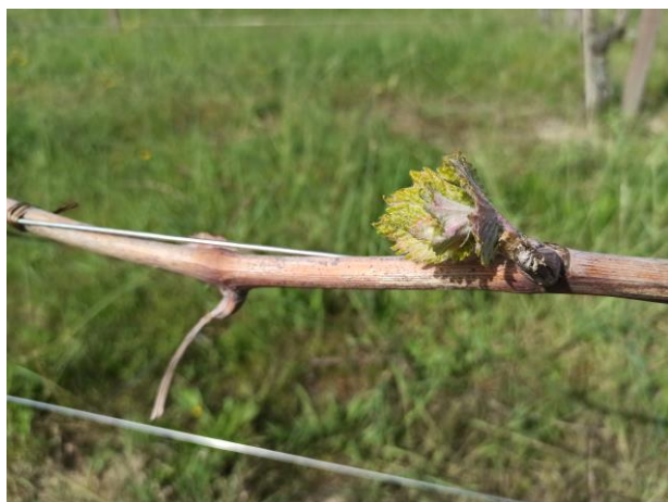
Montepulciano – apertura gemme (BBCH 08)

Vista la fase fenologica della coltura e le condizioni meteorologiche registrate negli ultimi giorni al momento non sono necessari interventi di difesa.