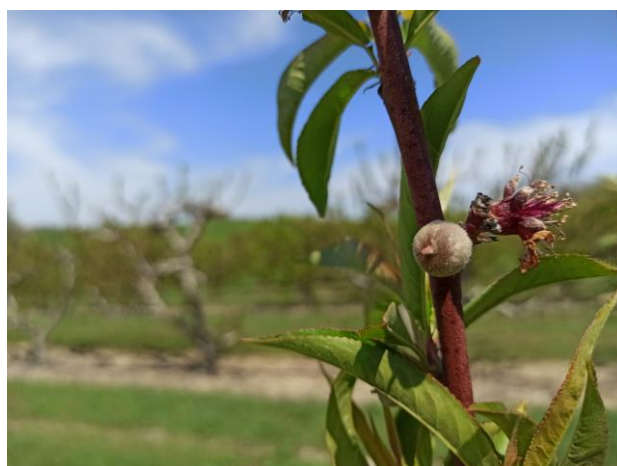
Pesco – Scamiciatura (BBCH 72)