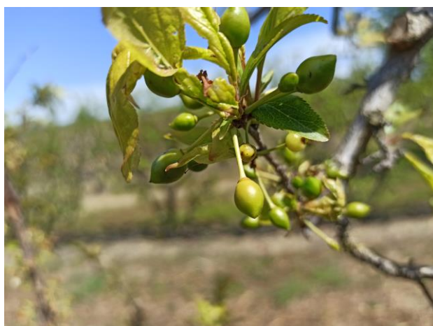
Susino – Accrescimento frutti (BBCH 73)