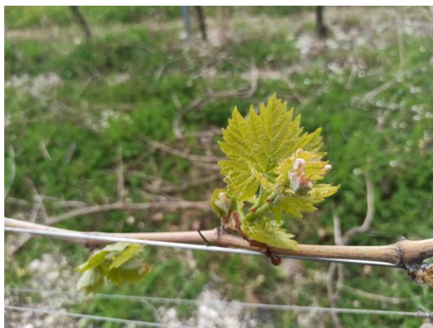
Sangiovese – prime foglie distese (BBCH13)