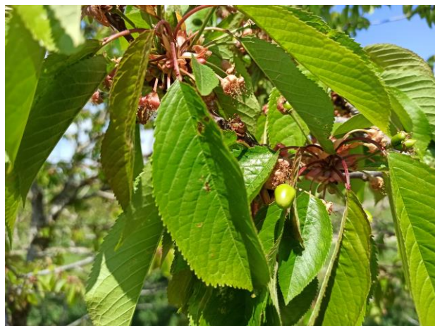
Ciliegio - allegagione (BBCH 71)