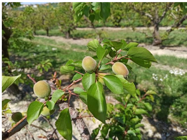
Albicocco - Accrescimento frutti (BBCH 74)