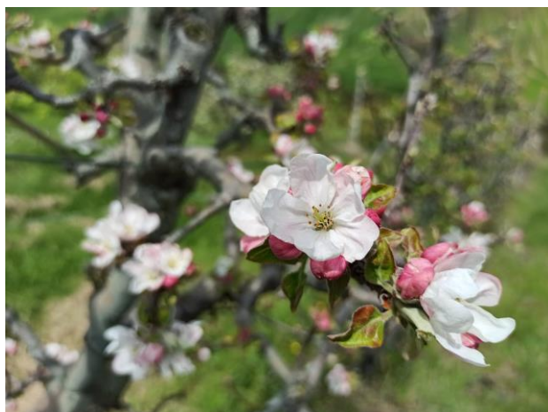
Melo – Piena fioritura (BBCH 65)