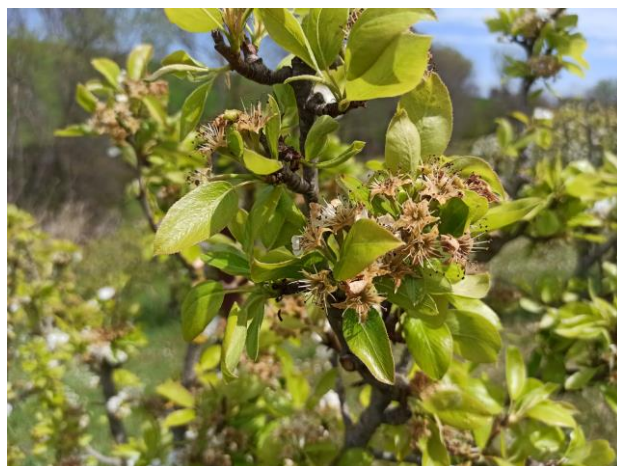
Pero – Fine fioritura (BBCH 69)