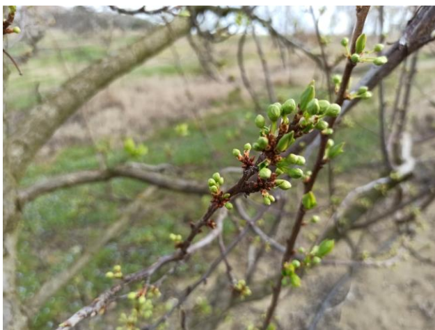
Susino – bottoni bianchi (BBCH 55)