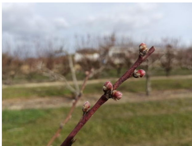
Pesco – bottoni rosa (BBCH 55)