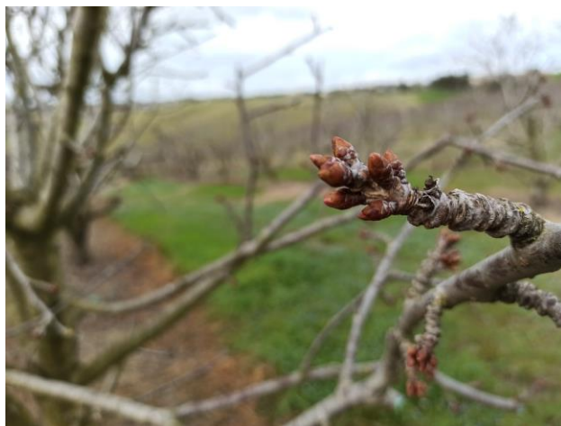
Ciliegio – rigonfiamento gemme (BBCH 01)