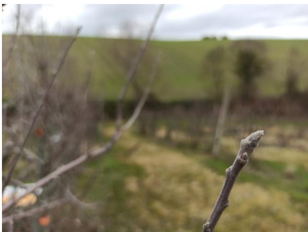
Melo – rigonfiamento gemme (BBCH 01)