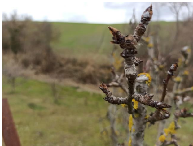
Pero – riposo vegetativo (BBCH 00)