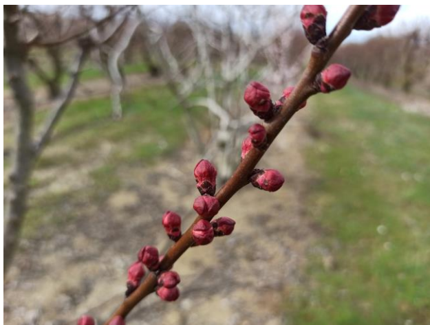
Albicocco - bottoni rosa (BBCH 55)