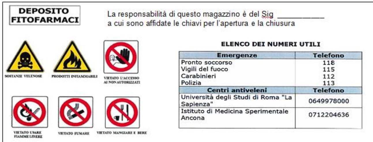
Figura 1 – Le indicazioni e i pittogrammi da apporre all'ingresso del locale adibito a deposito fitofarmaci