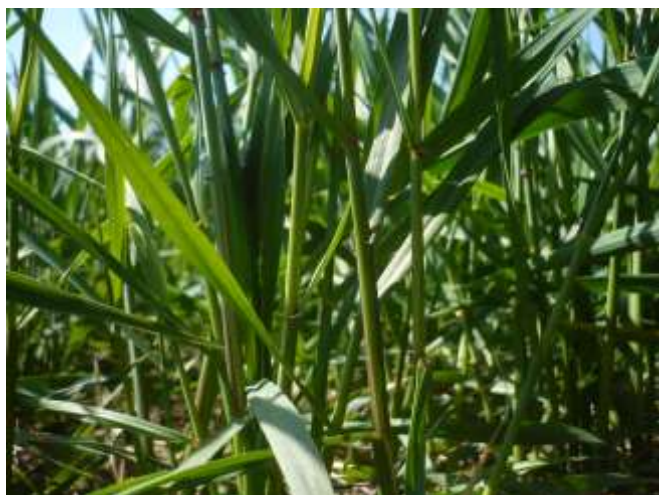
Frumento duro – levata 2 nodo BBCH 32

La fase fenologica dei cereali autunno-vernini è generalmente compresa fra secondo – terzo nodo (BBCH 32 - 33) .