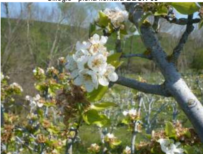
Pero - piena fioritura BBCH 65