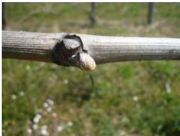
Trebiano – rigonfiamento gemme BBCH 01