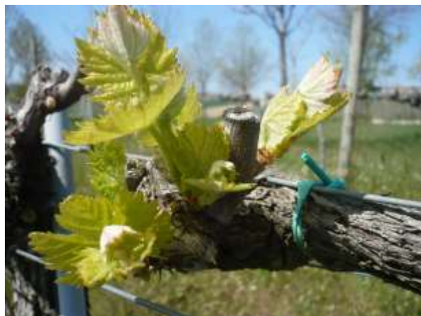
Sangiovese – prime foglie distese BBCH 12

La fase fenologica della vite è generalmente compresa (in funzione della varietà, della località e dell'esposizione) tra rigonfiamento gemme e prime foglie distese ( BBCH 01 - 12 ). Al momento non sono necessari interventi di difesa.