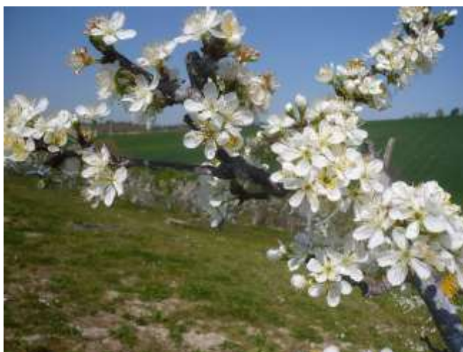
Susino (varietà tardiva) piena fioritura BBCH 65