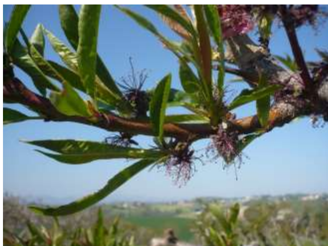
Pesco - allegagione BBCH 71