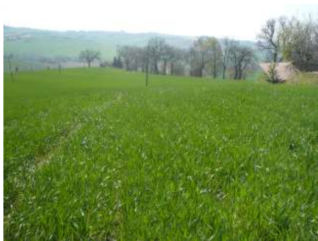
Frumento duro - appezzamento in buono stato vegetativo

Nella maggior parte dei campi in questi giorni sono stati eseguiti i diserbi e la seconda concimazione azotata. La coltura si presenta generalmente in buone condizioni vegetative e non si riscontrano problematiche particolari.