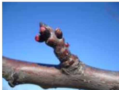
Formazioni fruttifere di albicocco

La potatura deve essere leggera anche per limitare l'insorgenza della gommosi.