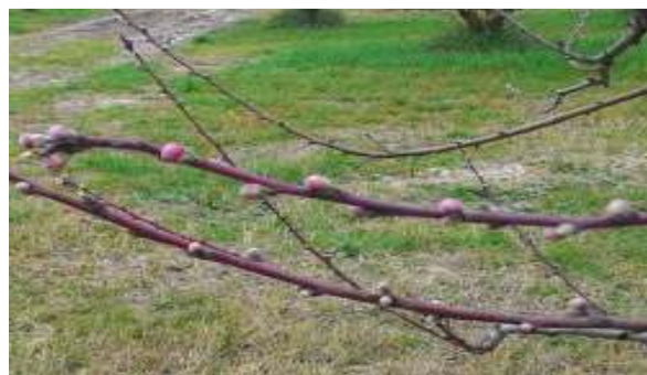
Rami fruttiferi di pesco

L' albicocco generalmente fruttifica sui rami misti e sui dardi fioriferi (strutture di fruttificazione formate da un cortissimo asse provvisto da numerose gemme a fiore laterali e da una gemma apicale a legno) di uno o due anni.