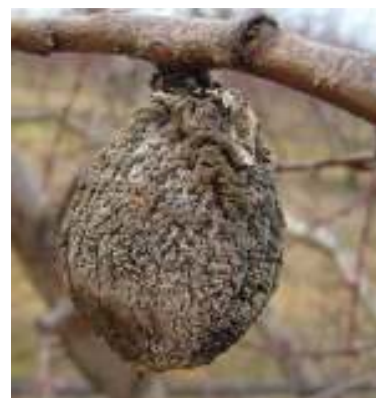
Frutto mummificato da monilia

Eventuali tagli straordinari di grandi dimensioni vanno subito disinfettati con appositi mastici per impedire l'ingresso di patogeni responsabili dei marciumi del legno mentre entro 2-3 giorni dalla