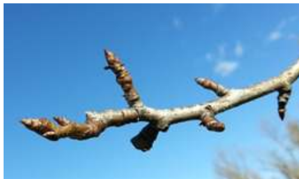
Formazioni fruttifere delle pomacee

POMACEE (melo e pero): le formazioni fruttifere preferenziali sono rami di due o più anni detti lamburde e in misura minore i brindilli (rametti di un anno di età, sottili e allungati con all'apice una gemma mista). Con la potatura va effettuato il solo diradamento di queste porzioni al fine di stabilizzare nel tempo la produttività, limitare l'alternanza di produzione, in particolar modo nel melo e regolarizzare la pezzatura dei frutti.