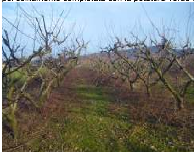
pescheto allevato a vaso con i residui della potatura

DRUPACEE (pesco, albicocco, ciliegio e susino): in queste specie in genere i frutti migliori si ottengono dai rami misti che possono anche essere spuntati; va evitato l'eccessivo sviluppo vegetativo nella parte alta della pianta per limitare l'ombreggiamento dei frutti; nel pesco la potatura è strettamente legata alla cultivar, in genere è comunque particolarmente energica, va poi solitamente completata con la potatura verde durante la stagione estiva.