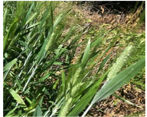
Grano duro, piena fioritura BBCH 69

Si ribadisce infatti l'importanza di intervenire al raggiungimento della fase di spigatura/inizio fioritura, con un intervento preventivo per il controllo della Fusariosi della spiga per evitare il possibile sviluppo di micotossine pericolose per la salute umana. Per i prodotti da impiegare si rimanda al Notiziario precedente n. 15