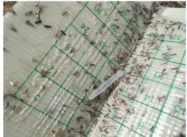
Adulti di Tignola dell'olivo su trappola

Dai monitoraggi effettuati nelle aziende della rete si rileva il volo della Tignola dell'olivo ( Prays oleae ) con catture di diverse centinaia di individui/trappola, pertanto, esclusivamente nelle aziende a conduzione biologica , si consiglia, dopo le piogge dei prossimi giorni, e comunque entro sabato 9, di effettuare un trattamento sulla generazione antofaga, con Bacillus thuringiensis (♣) o, in alternativa, con Silicato di alluminio (caolino calcinato) (♣), seguendo le indicazioni riportate in etichetta.