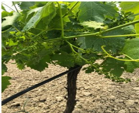
Sangiovese – bottoni fiorali separati (BBCH 57)