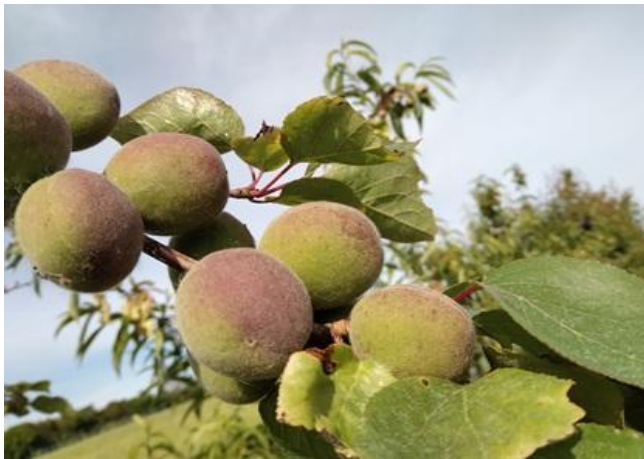
Albicocco: accrescimento frutto BBCH 79