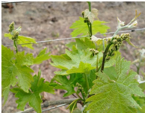
Montepulciano - grappoli separati (BBCH 55)

La coltura si trova generalmente nella fase fenologica fra grappoli separati e bottoni fiorali separati (BBCH 55-57)