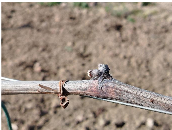
Trebbiano – rigonfiamento gemme (BBCH 01)

Al momento non è necessario alcun intervento.