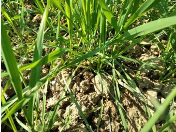
Frumento duro: inizio levata BBCH 30

Negli appezzamenti dove la coltura è nelle fasi più avanzate e dove sia stata eseguita la prima concimazione azotata già da qualche tempo, a meno che non siano stati impiegati concimi a lento rilascio distribuiti in un unico passaggio, si ritiene opportuno ricordare che ad inizio levata è necessario almeno un secondo intervento con fertilizzanti azotati e per le indicazioni sulle necessità e quantità da distribuire si rimanda alle indicazioni del Notiziario 4/2026