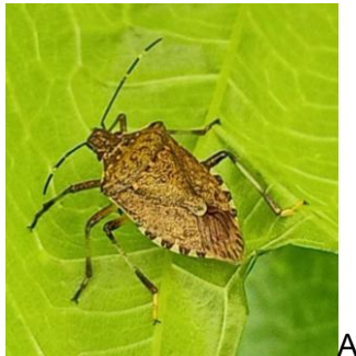
Adulto di cimice asiatica

Al fine di contenere la popolazione svernante potrebbe essere utile, già da questo momento, predisporre trappole per la cattura massale nei pressi dei siti di svernamento come centri aziendali, in prossimità dei manufatti (serre, edifici, ricoveri macchine ed attrezzi ecc...) o in prossimità di potenziali ricoveri naturali (siepi, ecc...). Le trappole possono essere acquistate e attivate con appositi feromoni oppure possono anche essere realizzate artigianalmente impiegando totem con attrattivi e pannelli collati.