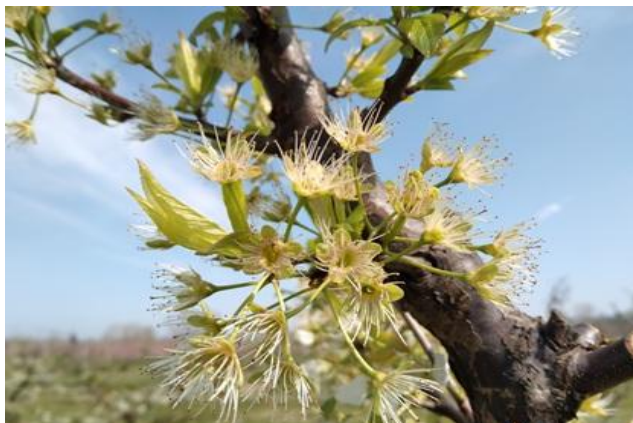
Susino: fine caduta petali BBCH 69