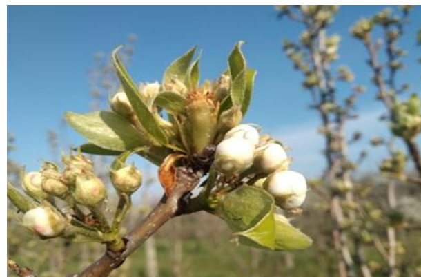
Pero: mazzetti divaricati BBCH 59