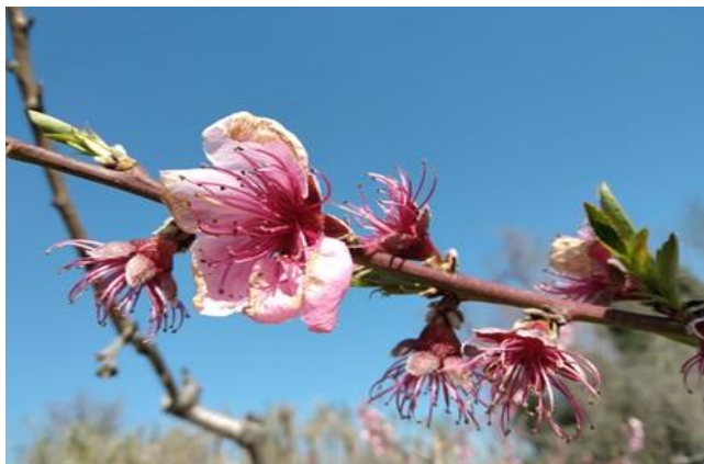
Pesco: fine caduta petali BBCH 69