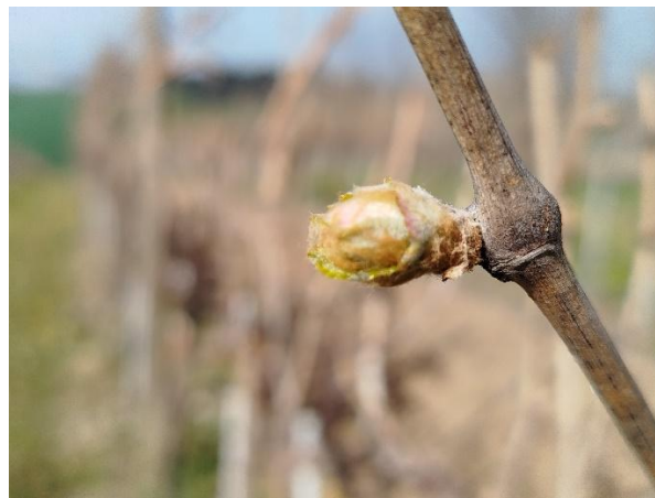
Sangiovese - punte verdi (BBCH 07)