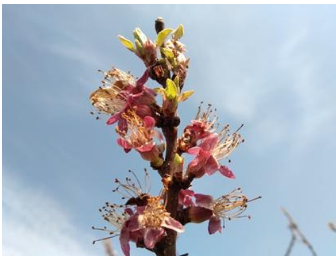
Albicocco: allegagione BBCH 71

Nelle pomacee, il melo è nella fase di punte verdi-orecchiette di topo BBCH 07-10 mentre il pero è da comparsa bocciolo florale a inizio fioritura BBCH 55-60 .