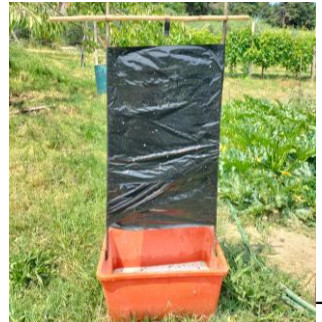
Trappola per la cattura massale tipo "totem"