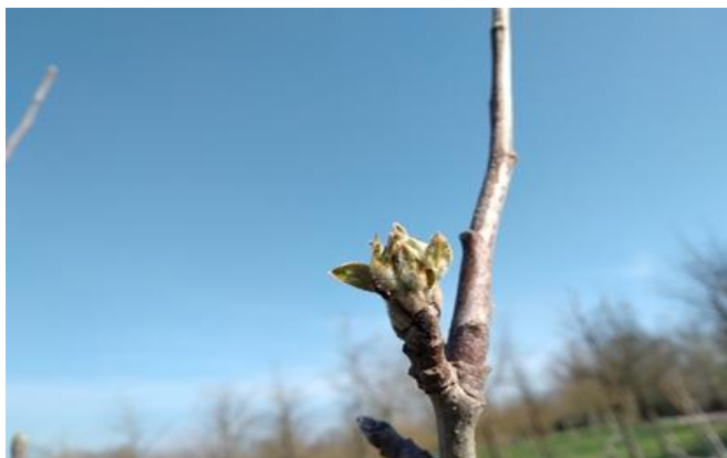
Melo: orecchiette di topo BBCH 10