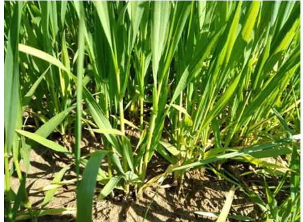
Frumento duro: primo nodo BBCH 31