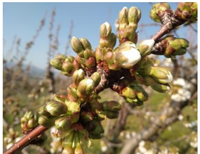
Ciliegio: bottoni bianchi BBCH 57