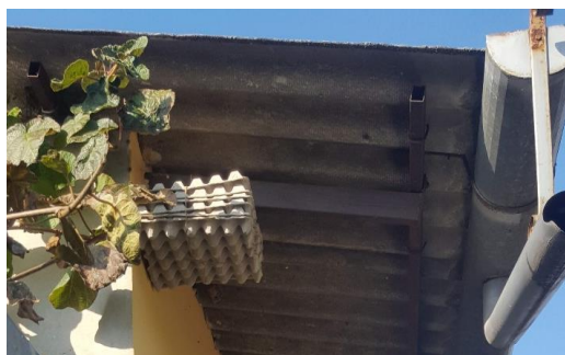
Trappola per la cattura massale tipo "cartone delle uova"