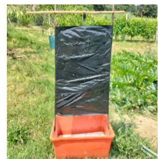
Trappola per la cattura massale tipo "totem"