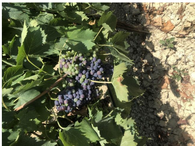
Sangiovese - inizio invaiatura (BBCH 81)