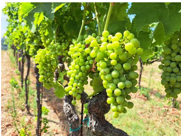
Montepulciano – chiusura grappolo (BBCH 79)

La vite si trova nella fase fenologica tra chiusura grappolo e inizio invaiatura BBCH 79-81 .