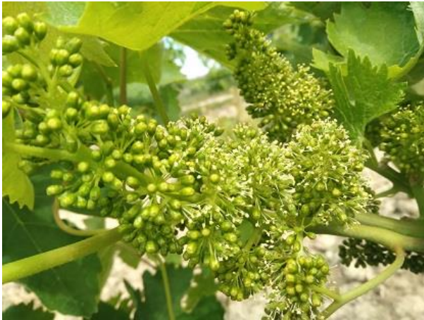
Inizio fioritura BBCH 61

Favorita dalle condizioni meteorologiche, caratterizzate da abbondante disponibilità idrica e temperature miti del periodo, la vite è in rapido accrescimento e si trova fra la fase fenologica di inizio fioritura e allegagione (BBCH 61 - 71)