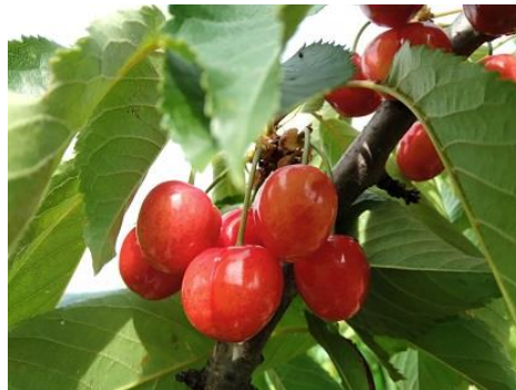
Ciliegio: invaiatura BBCH 81