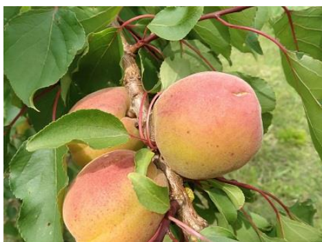
Albicocco: invaiatura BBCH 87

La fase fenologica raggiunta dall' Albicocco e dal Ciliegio è quella di maturazione di raccolta per le cultivar più precoci mentre per le altre si va da accrescimento frutto ad invaiatura BBCH78 - 87 . Pesco e Susino sono nella maggior parte dei casi tra la fase di accrescimento frutti ed inizio invaiatura BBCH 76 - 81 . Il Melo e il Pero hanno raggiunto la fase fenologica di accrescimento frutto BBCH 74 .