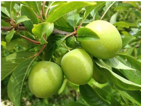
Susino: accrescimento frutti BBCH 78