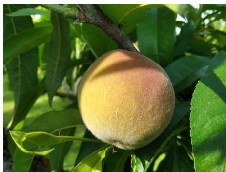
Pesco: inizio invaiatura BBCH 81