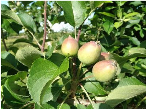
Melo: accrescimento frutto BBCH 74