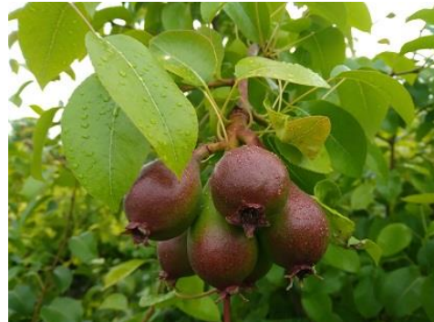
Pero: accrescimento frutti BBCH 74

Per il Pero si raccomanda di prestare massima attenzione alla presenza di Psilla ( Cacopsylla pyrisuga ).