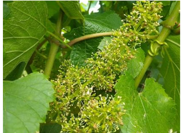
Allegagione BBCH 71