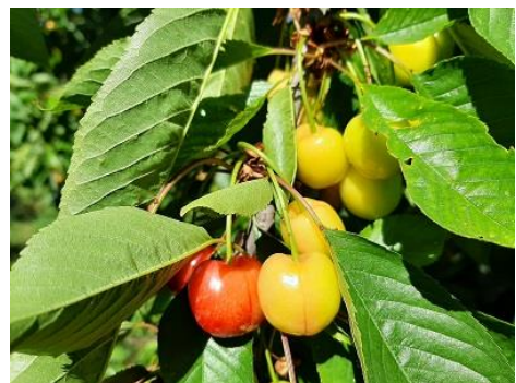
Ciliegio: inizio invaiatura BBCH 81