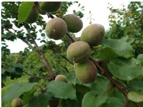
Albicocco: fine accrescimento frutti BBCH 79

Le drupacee: albicocco, pesco, susino sono nella maggior parte dei casi nella fase fenologica di accrescimento frutti BBCH 74 - 79 . Le cultivar più precoci di ciliegio hanno raggiunto la fase di invaiatura BBCH 81