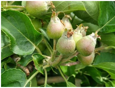
Melo: accrescimento frutti BBCH 72

Il melo si trova nella fase di accrescimento frutti BBCH 72 anche il pero è in accrescimento frutti BBCH74