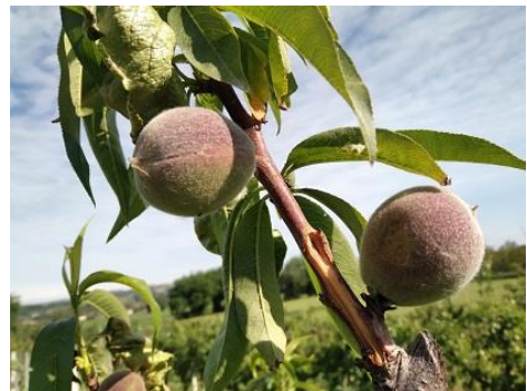
Pesco: accrescimento frutti BBCH 78