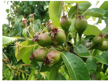
Pero: accrescimento frutti BBCH 74

Si riscontrano catture di Carpocapsa (Cydia pomonella) , pertanto, per coloro che intendono effettuare la lotta di tale insetto mediante il metodo della confusione sessuale, si raccomanda di procedere quanto prima, ad installare gli appositi dispenser.