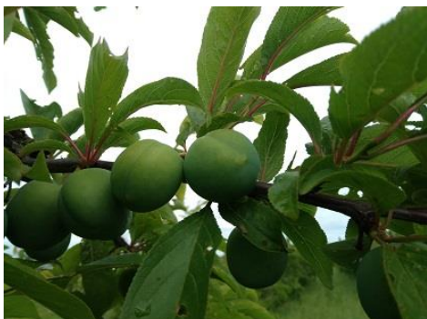
Susino: accrescimento frutti BBCH 78