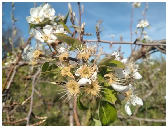
Pero: allegazione BBCH 71

Si ricorda che, durante il periodo della fioritura (periodo che va dalla schiusura dei fiori alla caduta dei petali), ai sensi della L.R. 33/12 e successiva modifica in materia apistica, sono vietati i trattamenti con prodotti fitosanitari ad azione insetticida ed acaricida. Si rimanda al testo della legge presente al seguente link . B.U. 23 febbraio 2023, n. 18