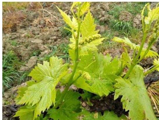
Vite: Da punte 1° foglia visibile a grappoli separati BBCH 07-55

Alle aziende che nella scorsa annata hanno riportato infezioni da Oidio e su varietà precoci già ricettive si suggerisce di intervenire con zolfo in polvere o micronizzato con l'aggiunta di Rame (♣) per cautelarsi da eventuali infezioni di Peronospora causate dalle piogge previste nei prossimi giorni.