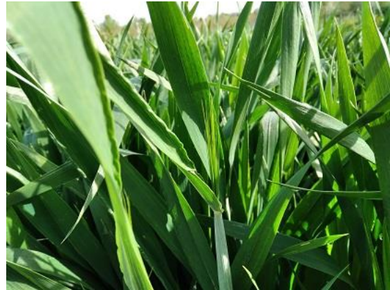
Frumento duro: Da 2° nodo a prime reste visibili BBCH 32-51