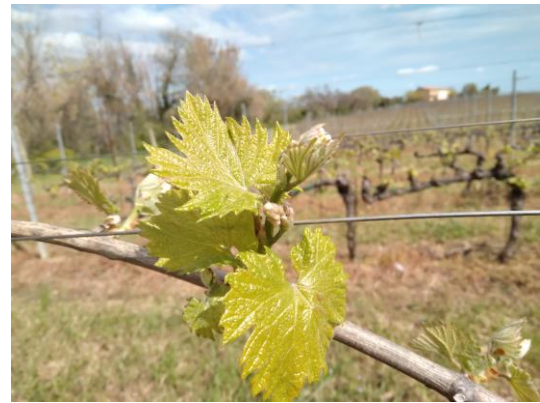
Vite: Da apertura gemme a grappoli visibili BBCH 08-53

Viste le basse temperature del periodo al momento non vi è necessità di intervenire