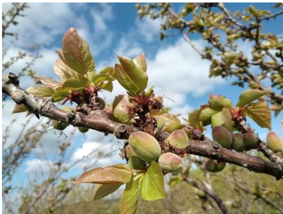
Albicocco: accrescimento frutti BBCH 74

Nei fruttiferi resta ancora marcata la differenza fra le fasi fenologiche raggiunte fra le diverse cultivar. Per quanto riguarda le drupacee l' albicocco è nella maggior parte dei casi nella fase fenologica compresa fra scamicatura e accrescimento frutti BBCH 72-74 , il pesco va dalla fase di allegazione a scamicatura BBCH 71-72 , il susino va da caduta petali fino ad inizio accrescimento frutti BBCH 69-74 , e il ciliegio è fra la fase di fine fioritura e scamicatura BBCH 69-72 .