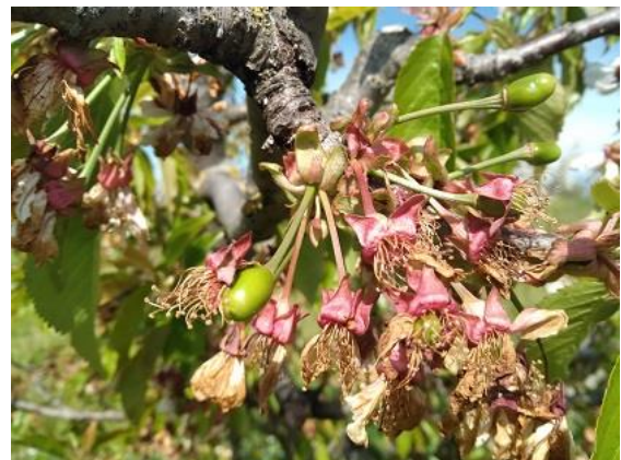
Ciliegio: scamicatura BBCH 72

Per le pomacee il melo si trova nella fase di mazzetti divaricati e inizio fioritura BBCH 59-60 mentre la fase fenologica del pero è fra fine fioritura e allegazione BBCH 69-71 .