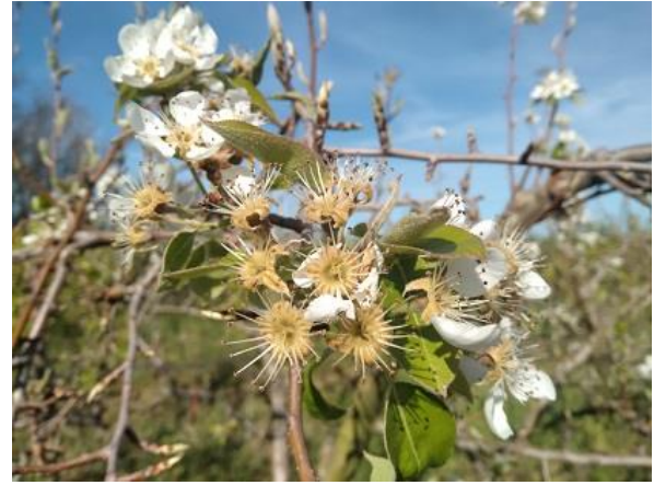
Pero: allegazione BBCH 71

Si ricorda che, durante il periodo della fioritura (periodo che va dalla schiusura dei fiori alla caduta dei petali), ai sensi della L.R. 33/12 e successiva modifica in materia apistica, sono vietati i trattamenti con prodotti fitosanitari ad azione insetticida ed acaricida. Si rimanda al testo della legge presente al seguente link . B.U. 23 febbraio 2023, n. 18