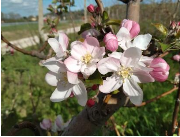
Melo: inizio fioritura BBCH 60