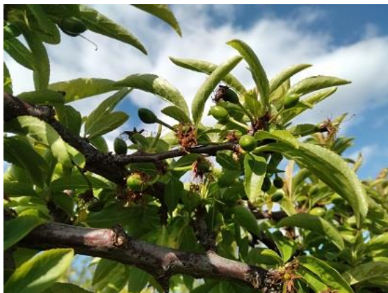
Susino: inizio accrescimento frutti BBCH 74