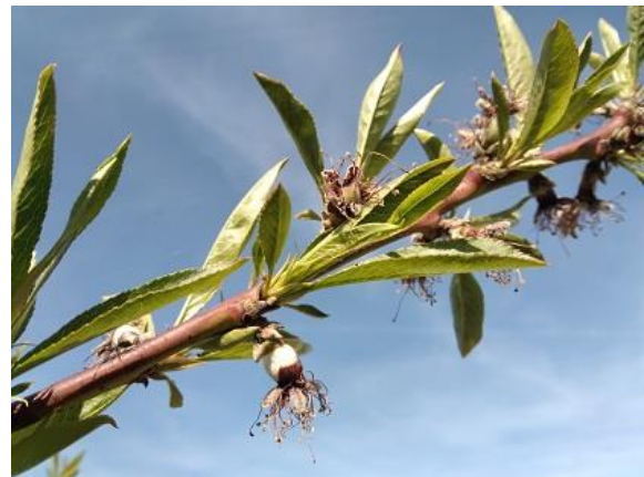
Pesco: scamicatura BBCH 72