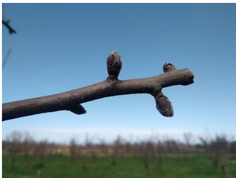
Melo: punte verdi BBCH 07