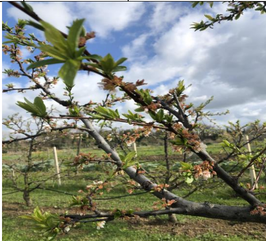
Susino: caduta petali BBCH 69

Al massimo 3 trattamenti all'anno contro questa avversità - ammessi 4 trattamenti su cultivar raccolte dal 15 agosto in poi