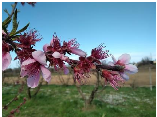
Pesco: fine fioritura BBCH 69