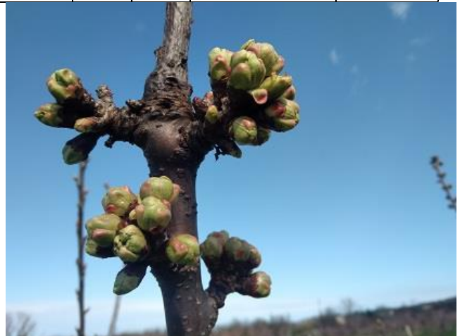
Ciliegio: boccioli visibili BBCH 55