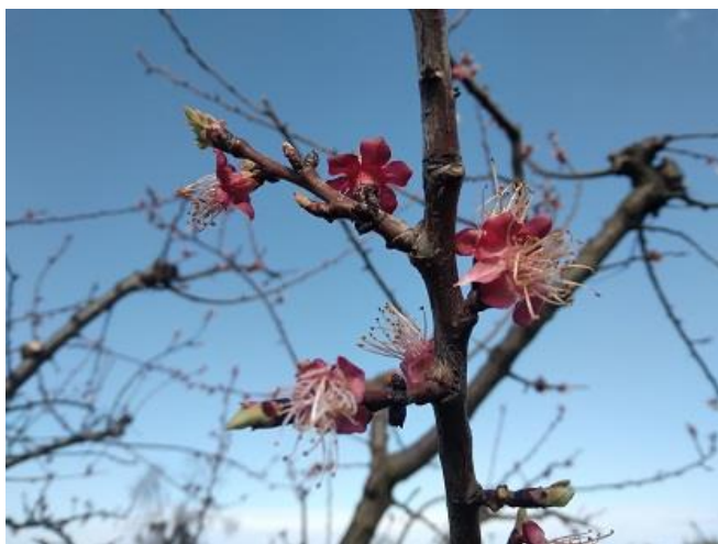
Albicocco fine caduta petali BBCH 69