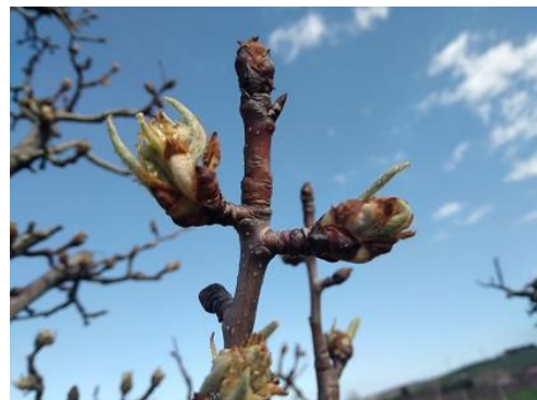
Pero: orecchiette di topo BBCH 10