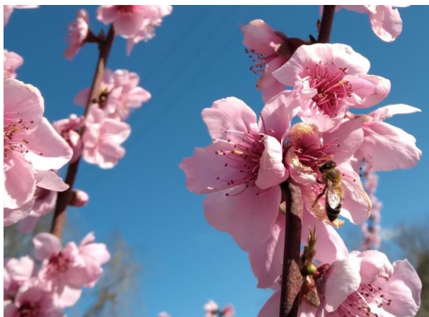
Pesco in piena fioritura BBCH 65

Il melo si trova tra gemma dormiente e rigonfiamento gemme BBCH 00-01 mentre il pero è fra rigonfiamento gemma e bottoni verdi nelle cultivar più precoci BBCH 01-56 .