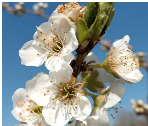
Susino piena fioritura BBCH 60

Si ricorda che, durante il periodo della fioritura (periodo che va dalla schiusura dei fiori alla caduta dei petali), ai sensi della L.R. 33/12 e successiva modifica in materia apistica, sono vietati i trattamenti con prodotti fitosanitari ad azione insetticida ed acaricida. Si rimanda al testo della legge presente al seguente link. B.U. 23 febbraio 2023, n. 18