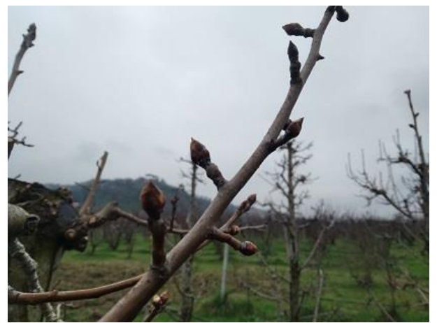
Pero: rigonfiamento gemme BBCH 01

Nella fase di prefioritura è molto importante procedere con trattamenti preventivi contro alcune delle avversità principali dei fruttiferi, diverse cultivar hanno ormai raggiunto questa fase, anche se è piuttosto evidente una certa scalarità fra le diverse cultivar dove quelle più tardive sono ancora nelle fasi più arretrate; sporadicamente è possibile notare alcune piante di pesco o susino già in fioritura, in questi casi si raccomanda di verificare la sanità delle piante, in genere si tratta di alberi parzialmente compromessi.