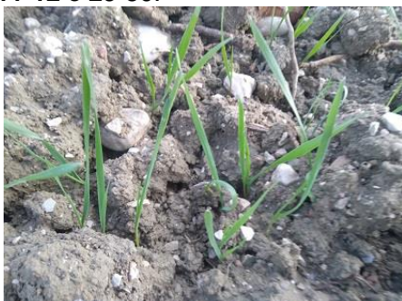
Frumento duro: una foglia BBCH 11

La fase fenologica dei cereali autunno vernini è nella maggior parte dei siti compresa fra una-due foglie per quelli seminati più tardivamente mentre i restanti si trovano fra fine accestimento e inizio levata BBCH 11-12 e 29-30 .