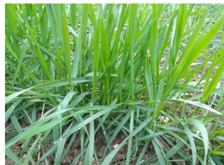
Frumento duro: fine accestimento BBCH 29