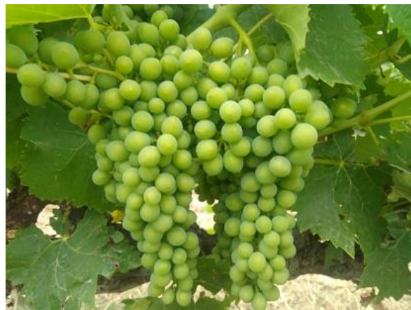
Chiusura grappolo BBCH 79

Nel precedente Notiziario 24 è stato consigliato un trattamento contro possibili infezioni di Peronospora e Oidio ; localmente le piogge potrebbero aver dilavato il trattamento od ostacolato l'esecuzione dello stesso, in questi casi si consiglia di intervenire tempestivamente con prodotti a base di: rame (♣) + Zolfo bagnabile (♣) + eventualmente Cerevisane (♣) o COS-OGA (♣).