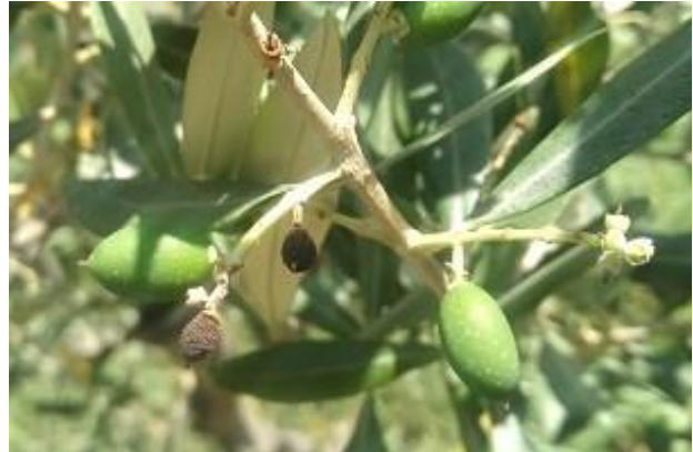
Disseccamento di frutticini per motivi fisiologici