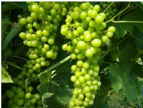
Prechiusura grappolo BBCH 77