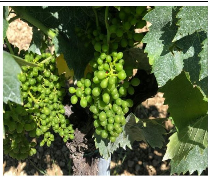
Inizio chiusura grappolo BBCH 77

Per le aziende che adottano il metodo della difesa integrata , il trattamento consigliato nel Notiziario 21 sta esaurendo la sua efficacia; pertanto, in considerazione della fase meteorologica ancora instabile e della nuova vegetazione da proteggere, si consiglia di intervenire entro Sabato 15 c.m. con i prodotti sottoelencati: