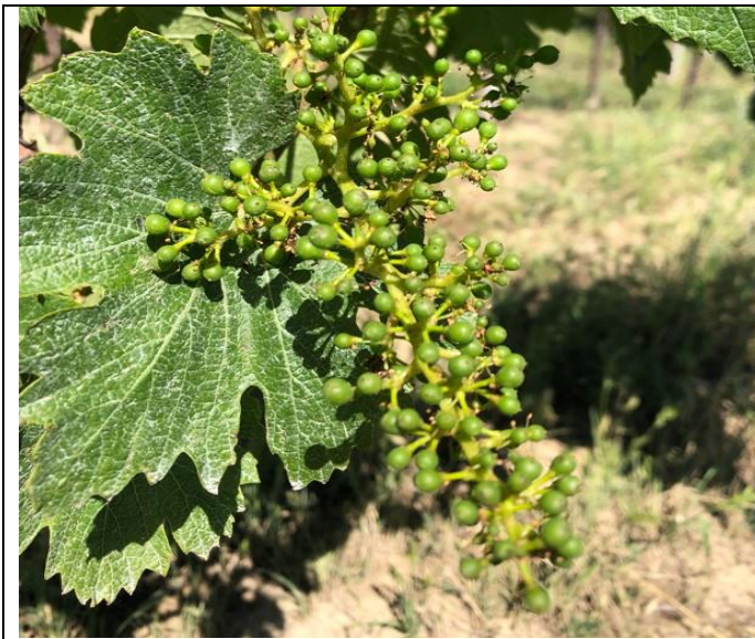
Mignolatura BBCH 73