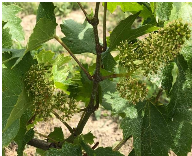
Bottoni fiorali separati BBCH 57