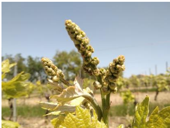
grappoli separati BBCH 55