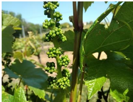
bottoni fiorali separati BBCH 57