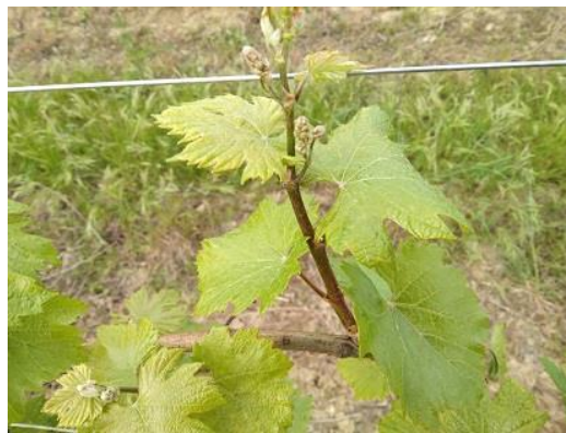
Vite : Da punte verdi a grappoli visibili BBCH 07-53

Alle aziende che nella scorsa annata hanno riportato infezioni da Oidio si suggerisce, prima possibile, di intervenire con zolfo in polvere ; mentre nei primi giorni della prossima settimana e comunque prima di eventuali piogge si consiglia di intervenire contro Peronospora e Oidio con prodotti a base di Rame (☛) + zolfo bagnabile micronizzato(☛) .