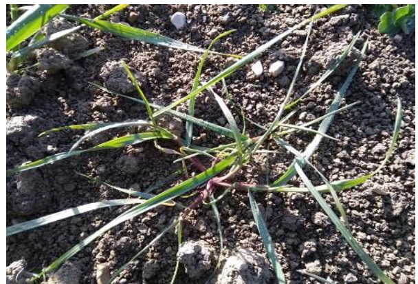
Infestanti su grano duro già sviluppate

Le sostanze attive riportate sono quelli presenti nelle: “Linee Guida per la Produzione Integrata delle colture, Difesa Fitosanitaria e Controllo delle Infestanti” della Regione Marche 2023 Finestra Estiva approvate con Decreto del Dirigente del Settore Struttura Decentrata Agricoltura di Pesaro n.