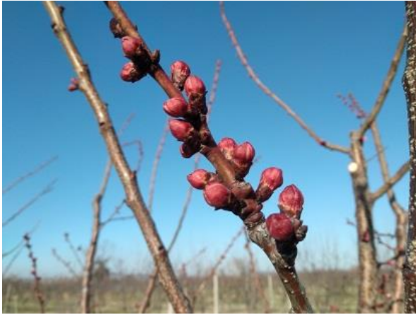
Albicocco BBCH 55