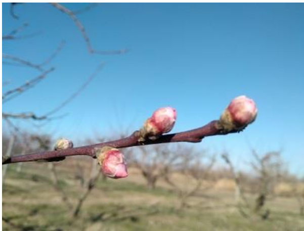
Pesco BBCH 55