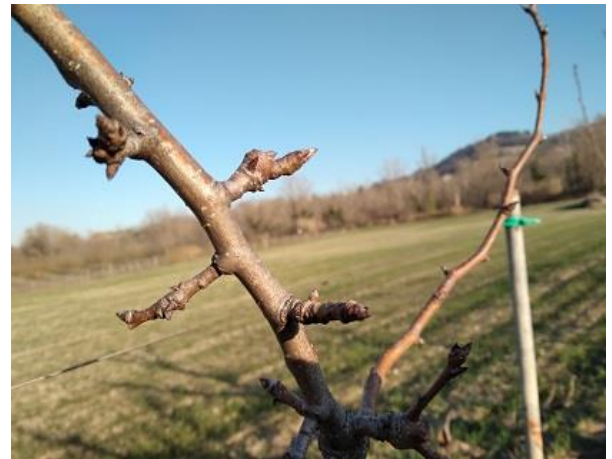
Pero BBCH 00

Si riportano di seguito i trattamenti consigliati in prefioritura.