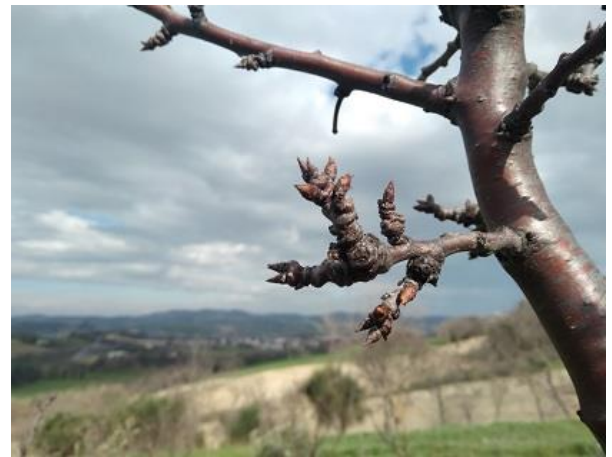
Susino BBCH 01