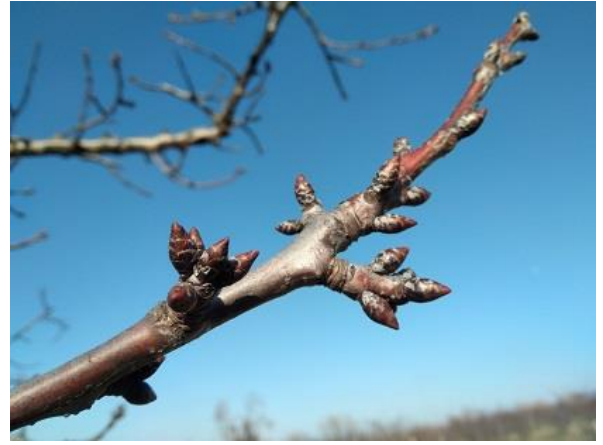
Ciliegio BBCH 01