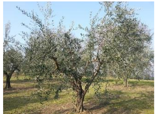
Forma di allevamento a Vaso policonico

La chioma viene conformata intorno ad una struttura scheletrica (tronco e branche primarie) tale da supportare uno sviluppo spaziale proporzionale alle capacità di rifornimento dell'apparato radicale. Le branche primarie si dipartono da un tronco alto 1-1,20 m, in numero di 4-5 (numero maggiore solo in caso di alberi di notevoli dimensioni), inclinate verso l'esterno, con un diametro che si riduce progressivamente procedendo verso la