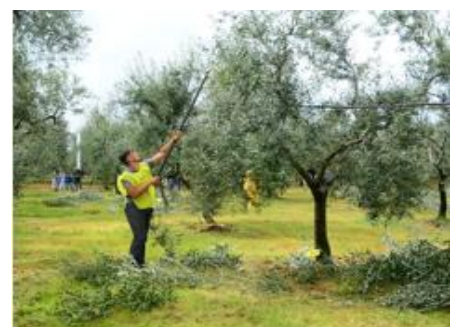
Potatura da terra a vaso policonico