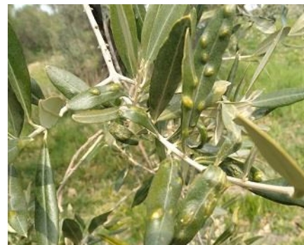
Danni da cecidomia

Negli oliveti con presenza di Cecidomia dell'olivo (patologia riscontrata nelle aree più a nord della regione, seppur in regressione), in questo periodo, qualora se ne rilevi la presenza, si consiglia di anticipare la potatura e comunque di effettuarla entro la metà di aprile, epoca del possibile inizio dello sfarfallamento, di asportare i rami maggiormente colpiti, di effettuare potature più energiche in modo da stimolare le piante più deboli e ad un ricaccio più vigoroso, si è osservato infatti che il patogeno predilige piante più deboli, effettuata l'operazione di potatura asportare le ramaglie e distruggerle.