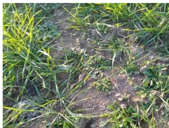
Infestanti su frumento duro