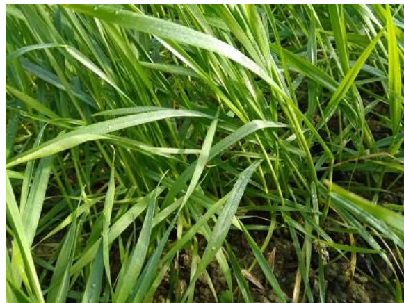
Frumento duro: inizio levata BBCH 31