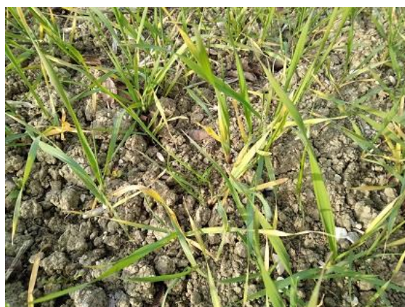
Ingiallimenti dovuti da carenza azotata