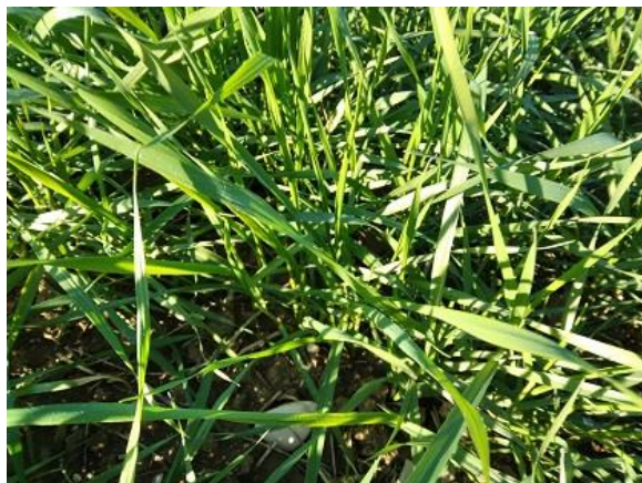
Frumento duro: fine accestimento BBCH 29

Strigliatura: Per le aziende biologiche (dove non è ammesso l'intervento chimico per il controllo delle infestanti), in corrispondenza e non più tardi della fase di fine accestimento, si raccomanda di effettuare la strigliatura, mediante erpice strigliatore, utile per rinettare il terreno dalle malerbe appena emerse e/o in emergenza.